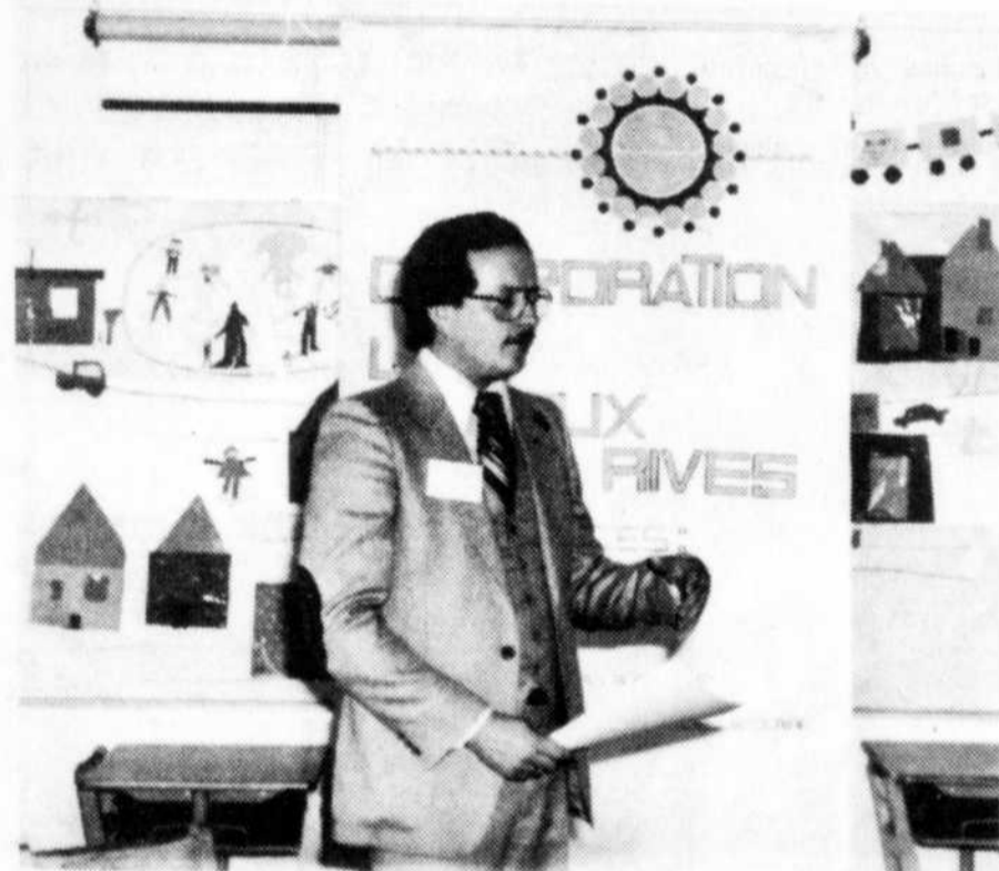
(Studio J.-Guy Gauthier)

Selon Elyse Beaulieu, le plus grand but que l'on doit se fixer c'est l'intégration ou la réinsertion sociale du déficient mental. S'intégrer signifie ajoute-t-elle: faire partie intégrante d'un ensemble, ne pas en être exclu, vivre où les autres vivent, vivre comme les autres vivent, ne pas être inutilement étiqueté, pouvoir rencontrer et communiquer avec des personnes non déficientes de son groupe d'âge et avoir les mêmes privilèges et les mêmes droits que les autres citoyens.