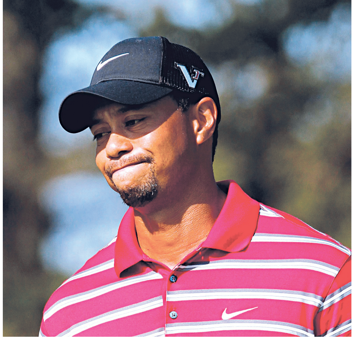
JOHN SUMMERS II REUTERS