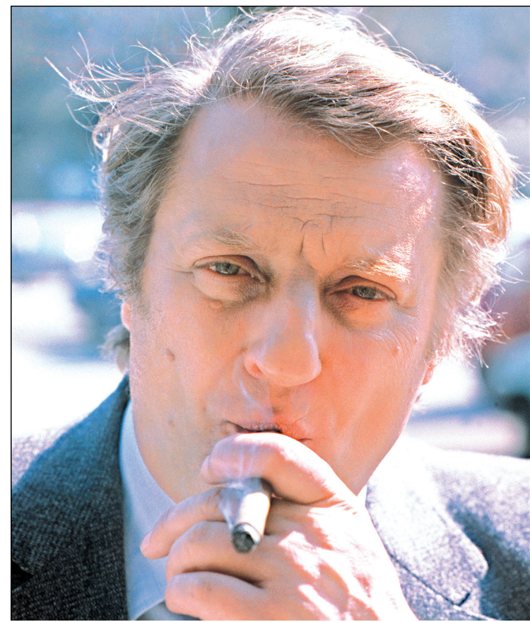
Bruno Cremer en janvier 1970.