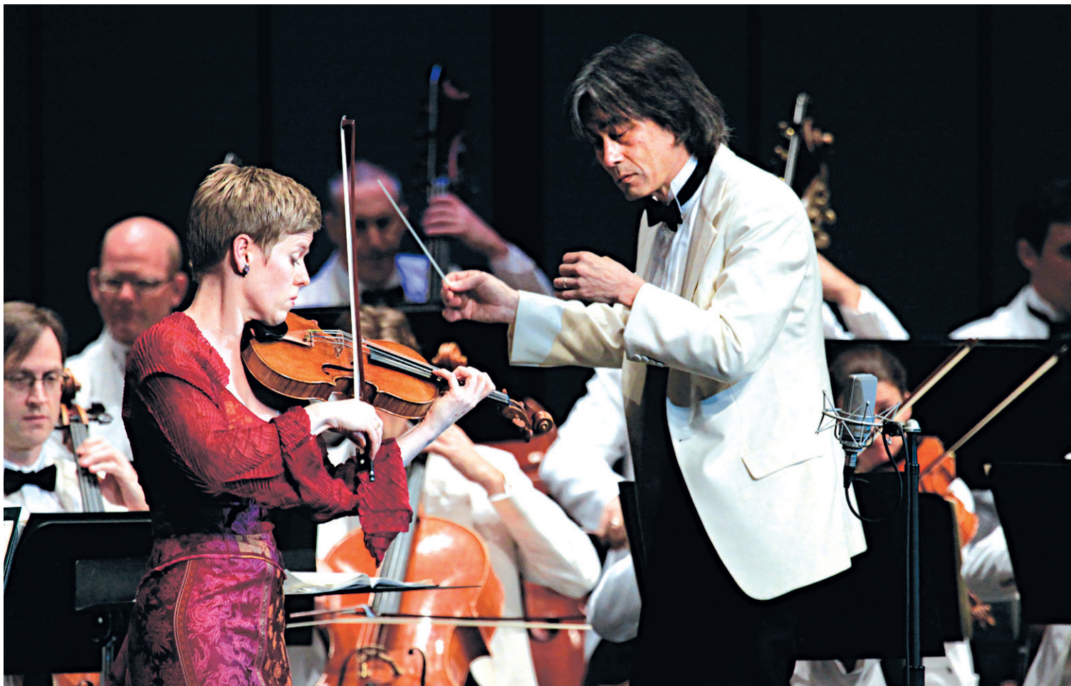
Isabelle Faust a transformé le Concerto pour violon de Brahms en origami.