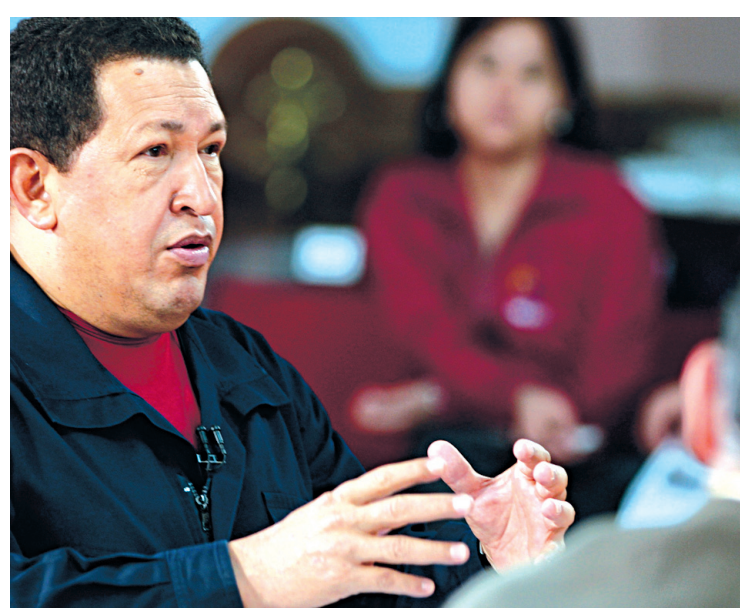
Hugo Chávez au palais présidentiel de Caracas, hier.

Par ailleurs, Hugo Chávez et son homologue colombien Juan Manuel Santos s'entreprendront demain en Colombie, un peu moins d'un mois après la rupture des relations diplomatiques entre les deux pays, a annoncé hier la ministre colombienne des Affaires étrangères.