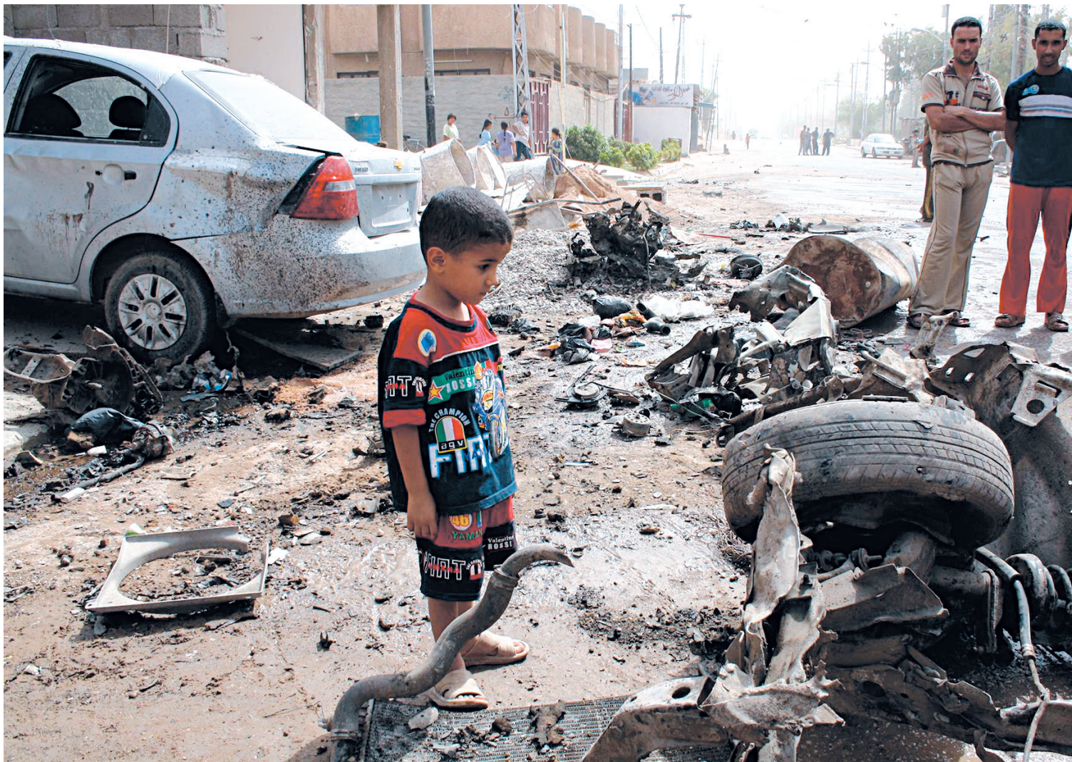
AZHAR SHALLAL/AGENCE FRANCE-PRESSE

À Fallouja, à l'ouest de Bagdad, des hommes cagoulés ont cambriolé hier le propriétaire d'un bureau de change avant de faire exploser leur voiture, tuant deux personnes et en blessant neuf.