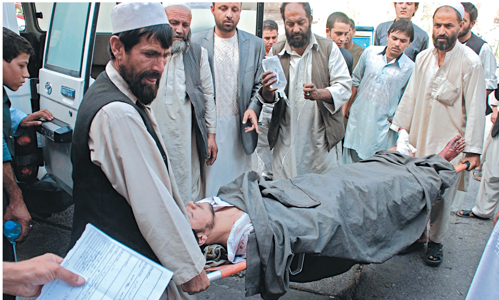
Blessé afghan transporté hier dans un hôpital de Herat, troisième ville de l'Afghanistan.