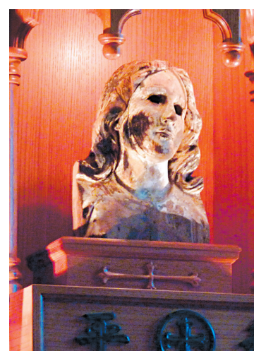
La tête de la Vierge Marie en bois qui a survécu au brasier.

«Nous avons voyagé partout avec la statue, avec l'espoir que la Vierge Marie puisse agir pour la paix», a déclaré à l'AFP