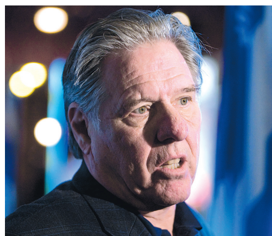
Aux Francs Tireurs, Pierre Curzi avait affirmé qu'il y avait une « mécanique politique » derrière le fait qu'on « boudait » les joueurs québécois au sein du Canadien.

Des déclarations qui n'ont pas manqué de faire réagir au Canada anglais. Hier, dans la page éditoriale du National Post , on se moquait joyeusement des « théories du complot » du député Curzi. « C'est toujours difficile de savoir si les séparatistes québécois croient vraiment les théories du complot