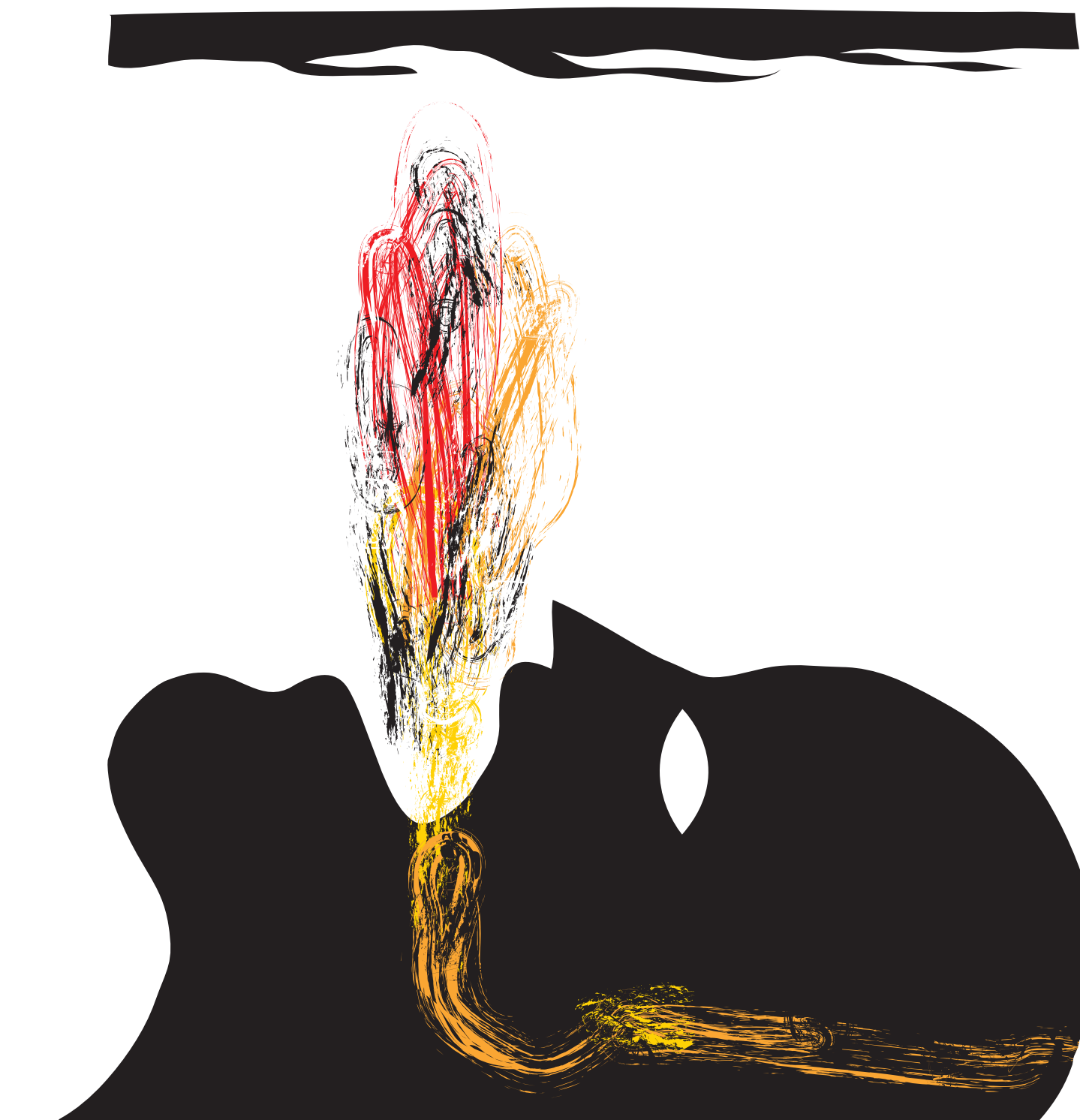
ILLUSTRATION CHRISTIAN TIFFET LE DEVOIR

Si l'EPA juge nécessaire de lancer une enquête d'envergure sur l'exploitation du gaz de schiste, c'est évidemment parce que plusieurs questions restent sans réponse. Appel d'urgence au gouvernement Cha-