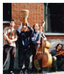
Le mercredi 20 juillet Gadji-Gadjo Six jeunes musiciens présentent un répertoire de style klezmer et tzigane où accordéon, violon, clarinette, guitare, contrebasse et percussions vous feront vibrer.