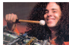
Le 29 juin CréaSon

Venez participer en grand nombre lors des soirées familiales qui se dérouleront tout l'été à la Place de l'église Sainte-Famille, située au 560, boul. Marie-Victorin. Ces activités ont lieu sur le parvis de l'église Sainte-Famille. En cas de pluie : Centre multifonctionnel.