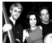
Le dimanche 7 août BLOOM trio

Un concert à l'ambiance des salons parisiens... une rencontre entre le 19 e siècle, la musique et vous !