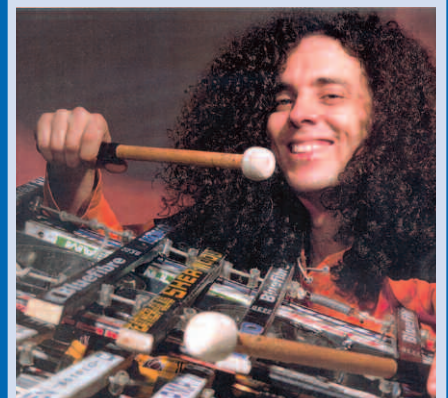
Concerts et spectacles