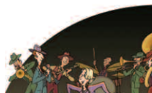
Le 27 juillet Le monde merveilleux du Dixie