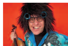
Le 13 juillet Violon Dingue