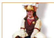
Le 10 août Circus Cowboy