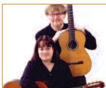
Le dimanche 10 juillet Intermezzo

Les dimanches 10 juillet et 7 août, faites place aux spectacles à l'occasion des Rendez-vous champêtres sur le site historique de la maison Louis-Hippolyte-Lafontaine. En cas de pluie, les spectacles seront annulés.