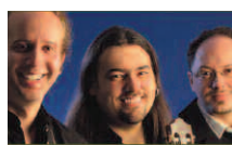
Le mercredi 17 août Trio de guitare de Montréal Musique éclectique et énergique qui voyage à travers les cultures du monde.