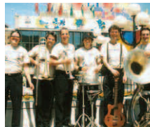
Le mercredi 3 août Esprit de swing Grands classiques du jazz des « swingbands » des années 30.