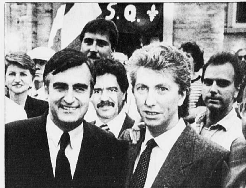
Lucien Bouchard a présenté hier le candidat souverainiste à l'élection partielle de Laurier/Sainte-Marie, M. Gilles Duceppe, au cours d'une assemblée qui a attiré quelque 800 partisans.

Le comédien Jean Duceppe est toujours sous observation à l'hôpital de Chicoutimi et son état est considéré comme « stable ». Le patient a été transporté d'urgence par hélicoptère dans cet établissement mardi après-midi après avoir subi un malaise pendant une excursion de pêche. Page 9