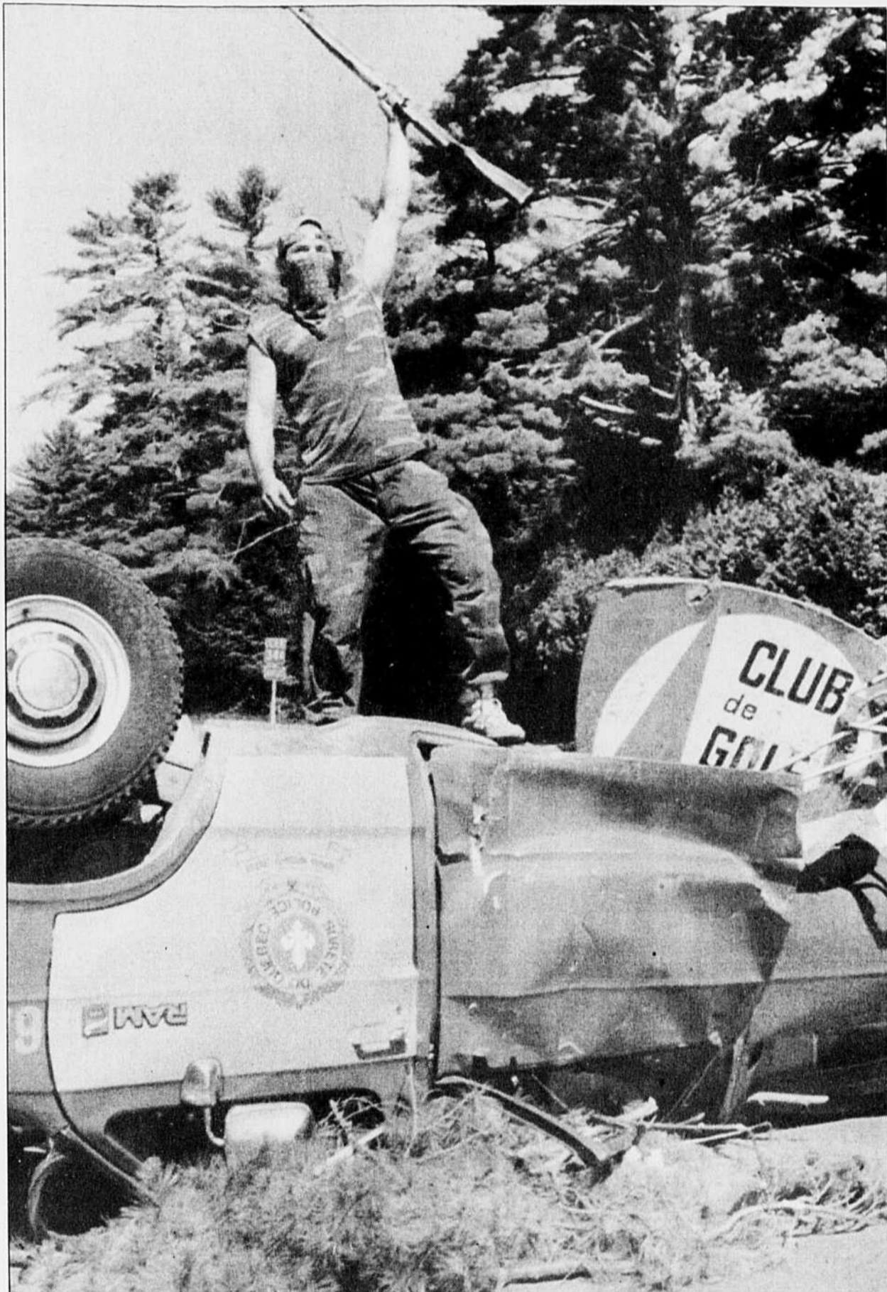
Un Warrior triomphant brandit son arme, juché sur un des véhicules de la Sûreté du Québec renversés par les Mohawks pour dresser un barrage sur l'autoroute longeant la réserve de Kahnéselake, près d'Oka.

C'est après le départ des policiers Voir page 12 : Un policier