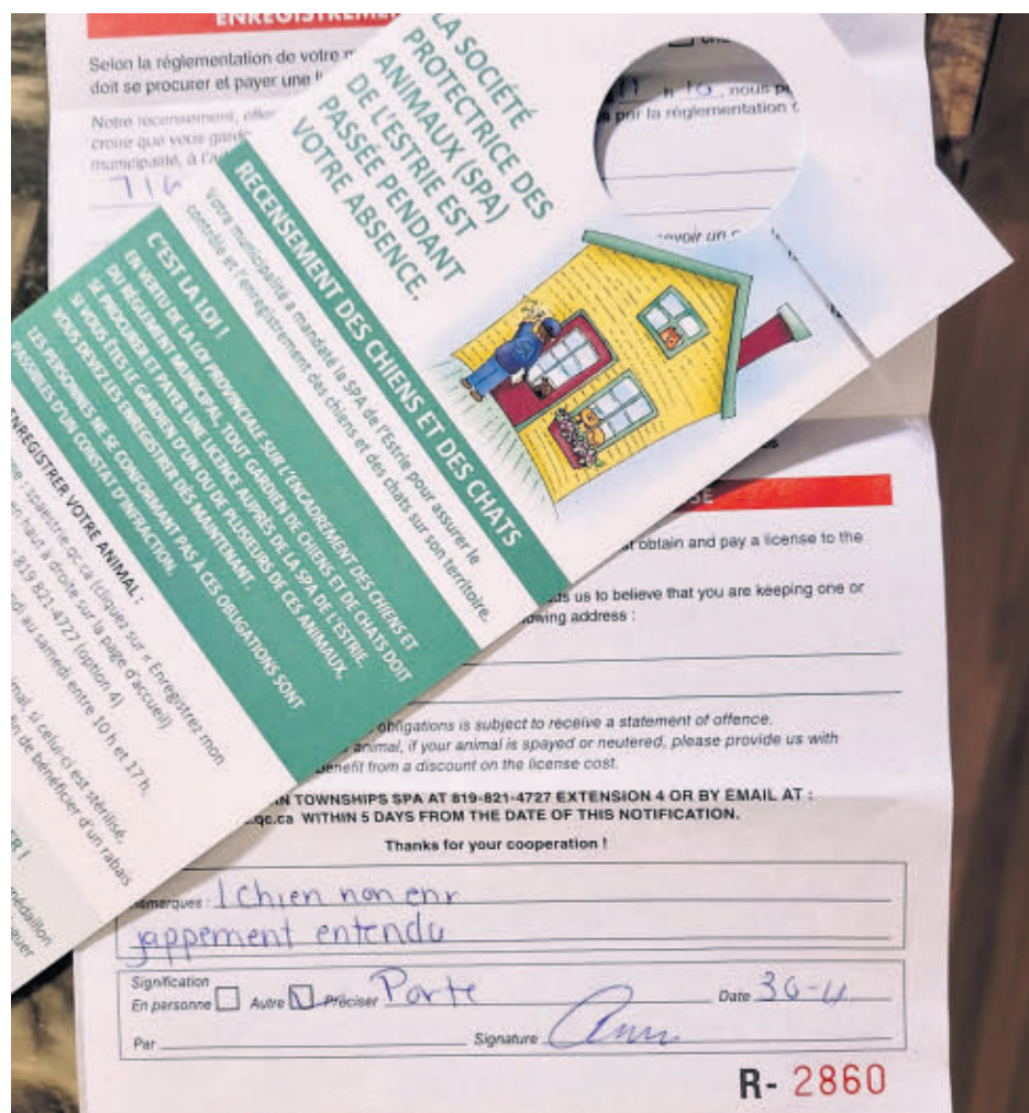
Une femme a reçu cet avis indiquant qu'en son absence, la représentante de la SPA a entendu japper un chien.