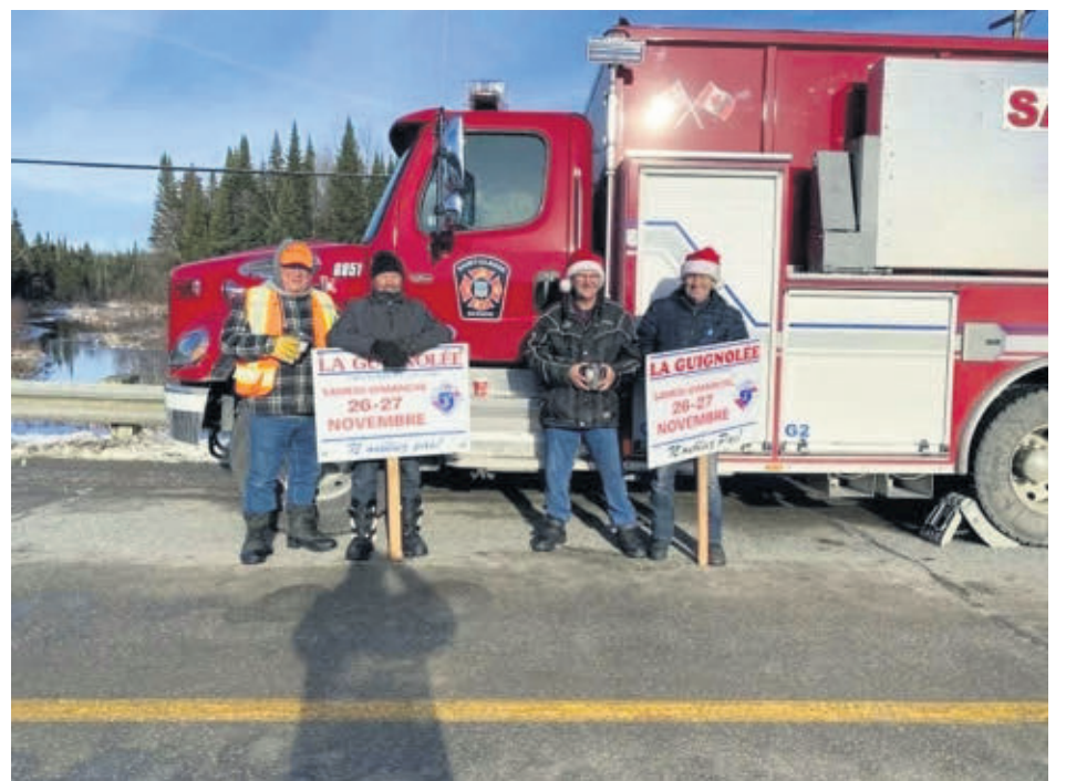
Les pompiers de Saint-Claude ont fait de même sur leur territoire.

ACTUALITÉS l'Étincelle AU SERVICE DES MRC DES SOURCES • VAL-SAINT-FRANÇOIS