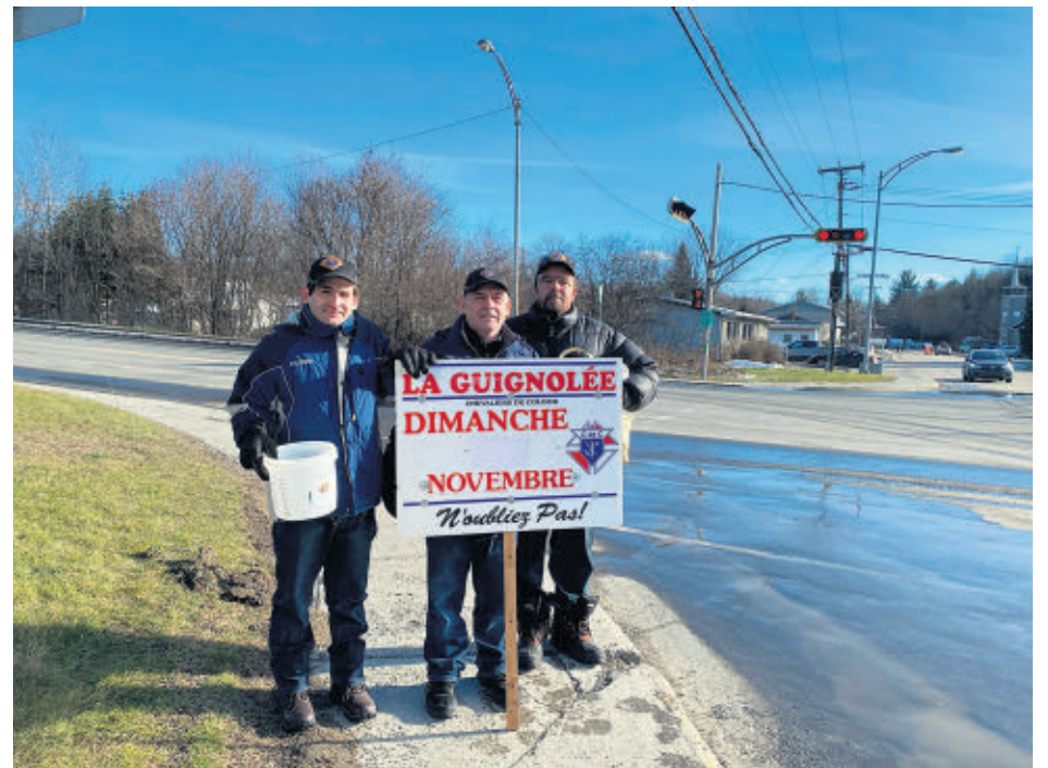
Pas moins d'une cinquantaine de personnes ont pris part de façon active à cette grande Guignolée des chevaliers de Colomb de Windsor.