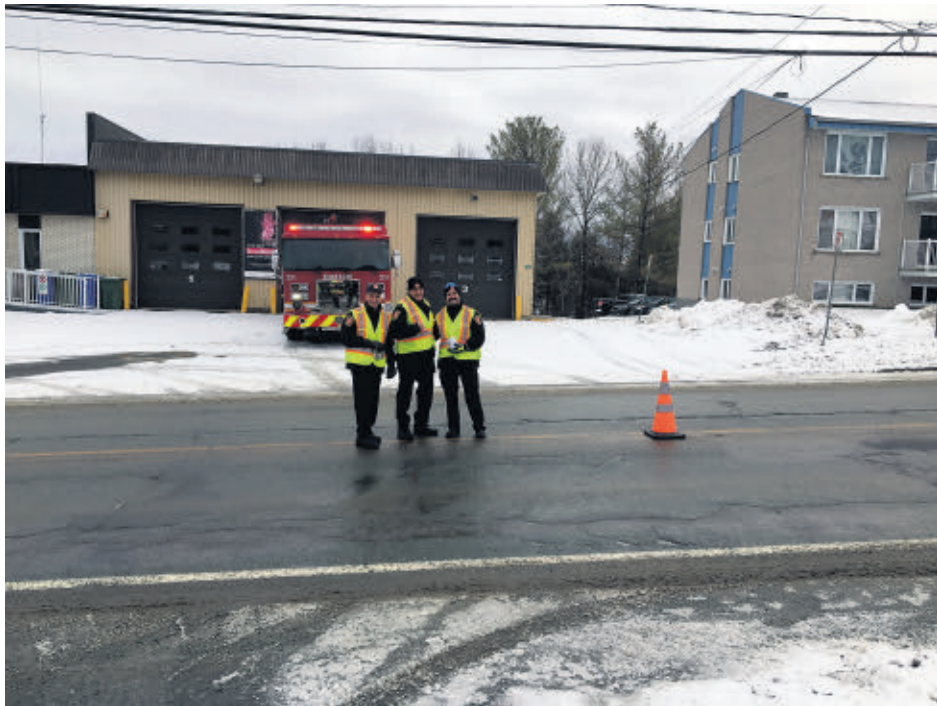
Les pompiers de Saint-François-Xavier-de-Brompton ont amassé des fonds en avant-midi le samedi.