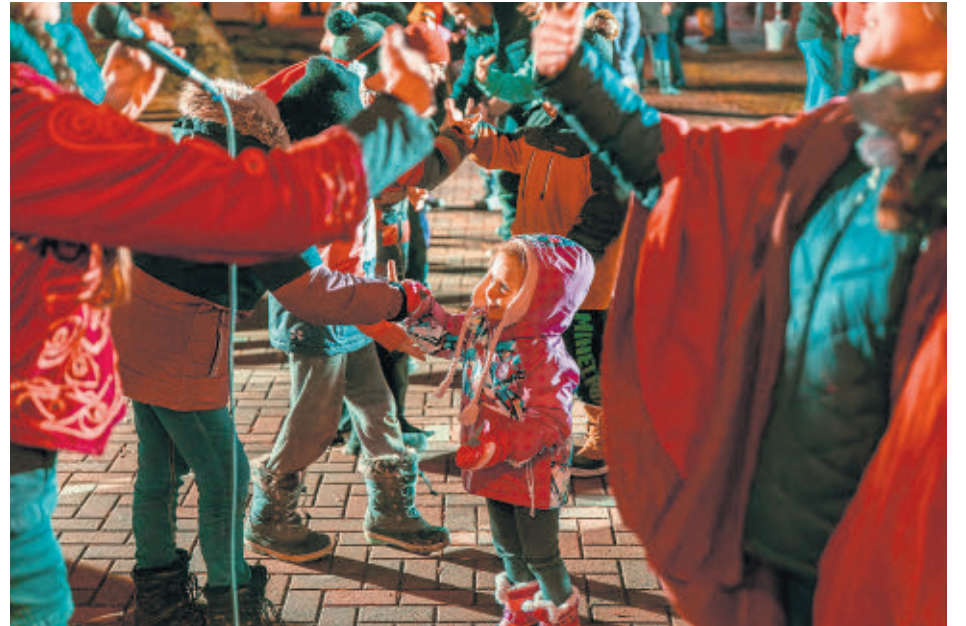
Les enfants ont été émerveillés par les différents tableaux du défilé.