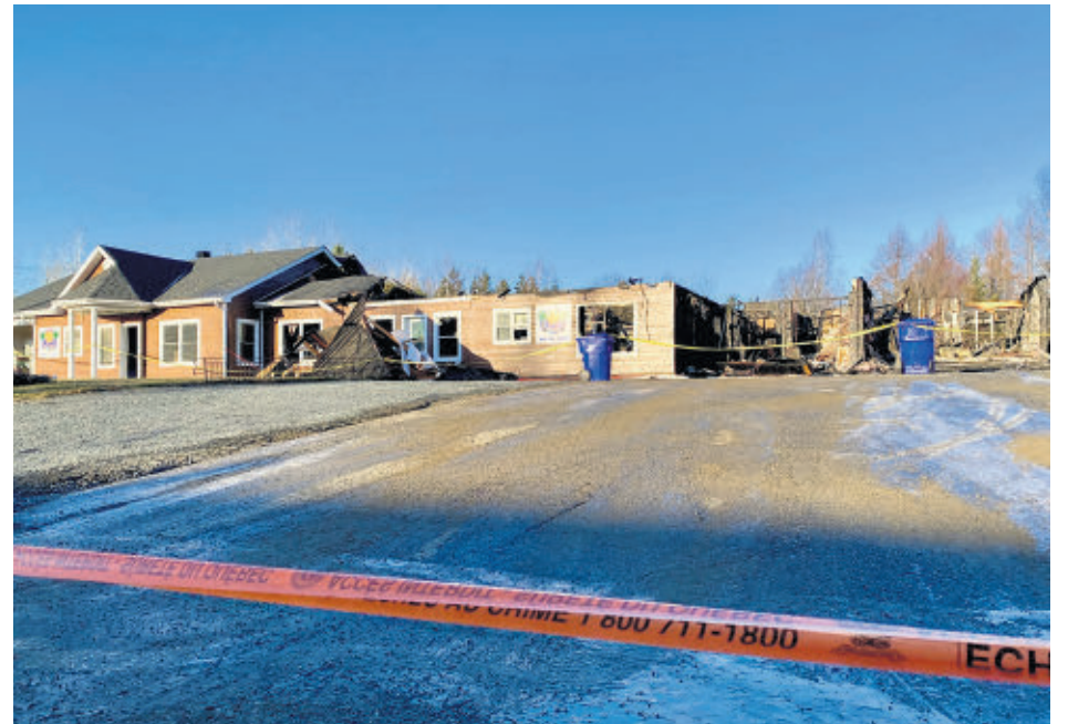
Le maire de Saint-Denis-de-Brompton était sur place tôt lundi matin, vers 6 h 30, pour constater l'ampleur des dégâts.

« La municipalité va évaluer de quelle façon elle pourra venir en aide aux parents. Cet incendie a un impact majeur sur notre population. C'est beaucoup d'enfants et les normes de sécurité pour les moins de cinq