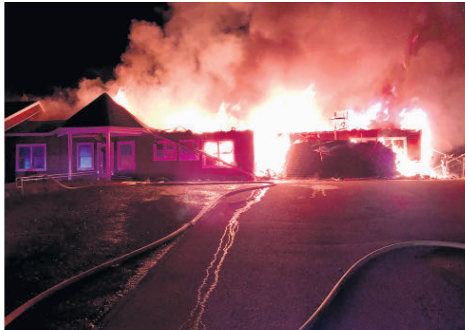
À 23 h 44, le premier officier rapporte un embrasement généralisé, donc un incendie d'une grande ampleur.