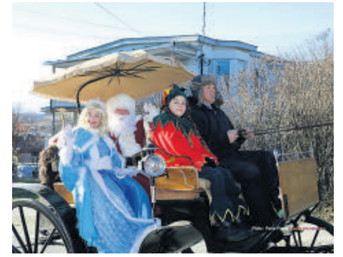
La visite du Père Noël était très attendue par les gens présents.

L'an prochain, le défilé sera de retour à moins d'une pandémie quelconque... « C'est vraiment devenu une tradition », termine la technicienne en loisir.