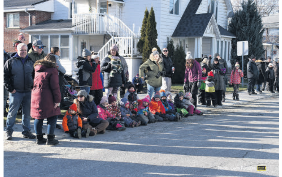
Des milliers de personnes se sont déplacées pour le traditionnel défilé de Noël.