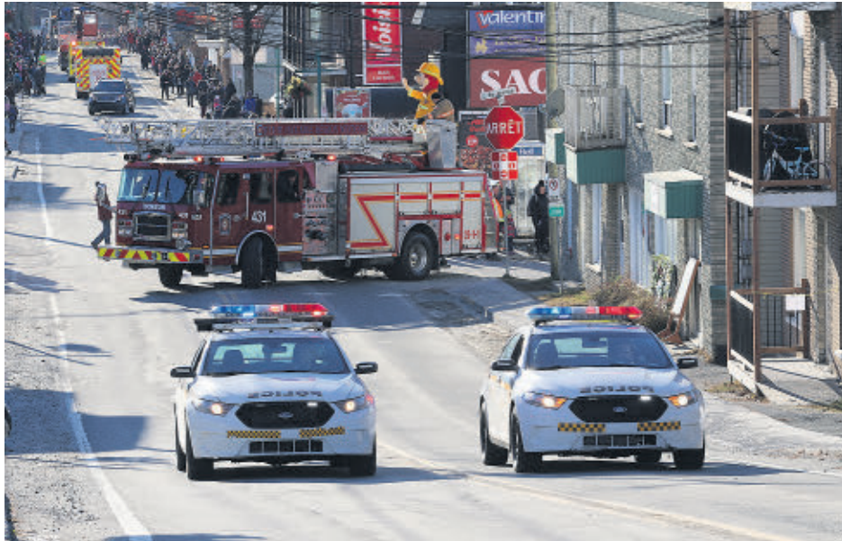
Les pompiers de la Ville étaient présents lors du défilé de Noël.