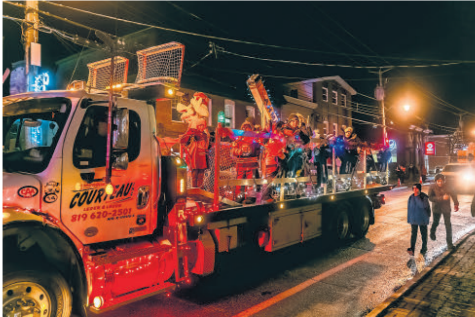
Les personnes présentes sur le parcours ont pu admirer pas moins de 40 chars allégoriques.

Ce défilé, ce sont des mois de préparation. « Cette semaine, nous aurons notre post mortem et nous allons déjà commencer à parler de l'an prochain. L'organisation débute au mois d'août », termine Mme Ménard.