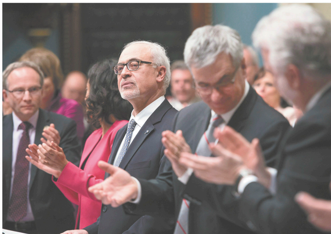
La situation du ministre des Finances, Carlos Leitão, fait peut-être l'envie de quelques-uns de ses homologues provinciaux.

S'il s'avérait qu'une proportion importante du surplus actuel soit cyclique et que le gouvernement décidait de dépenser de manière permanente une telle somme, soit en baisse d'impôts ou en dépenses supplémentaires, le Québec pourrait se placer dans une position de manque