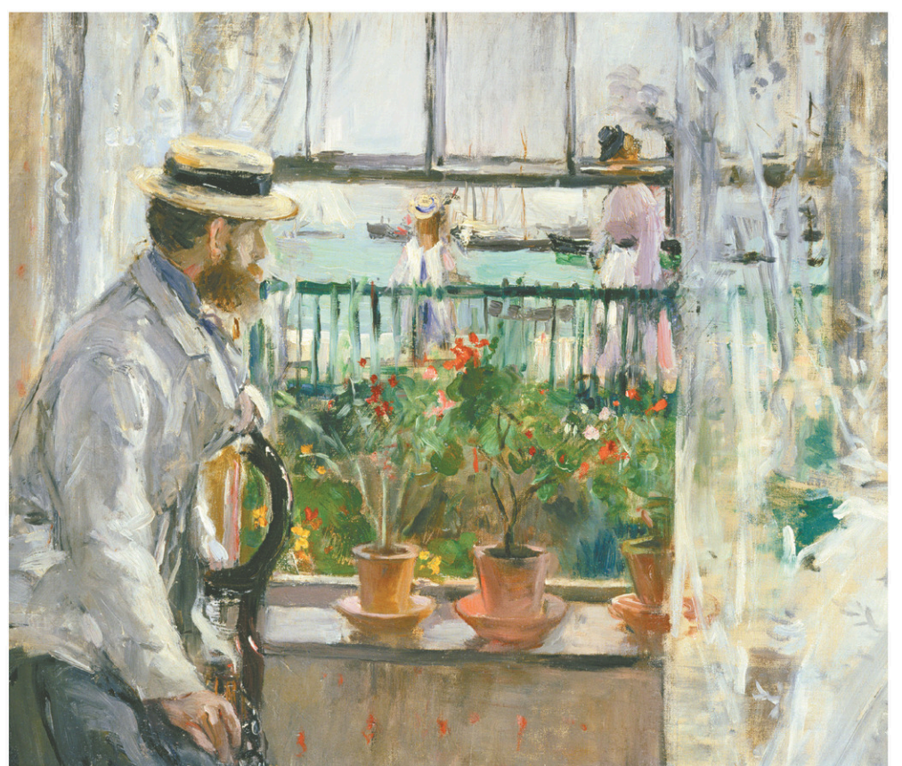
MUSÉE MARMOTTAN-MONET Eugène Manet à l'île de Wight, 1875, huile sur toile de Berthe Morisot