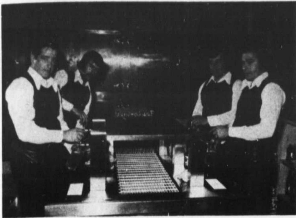
Un service rapide avec un équipement adéquat et un personnel qualifié.