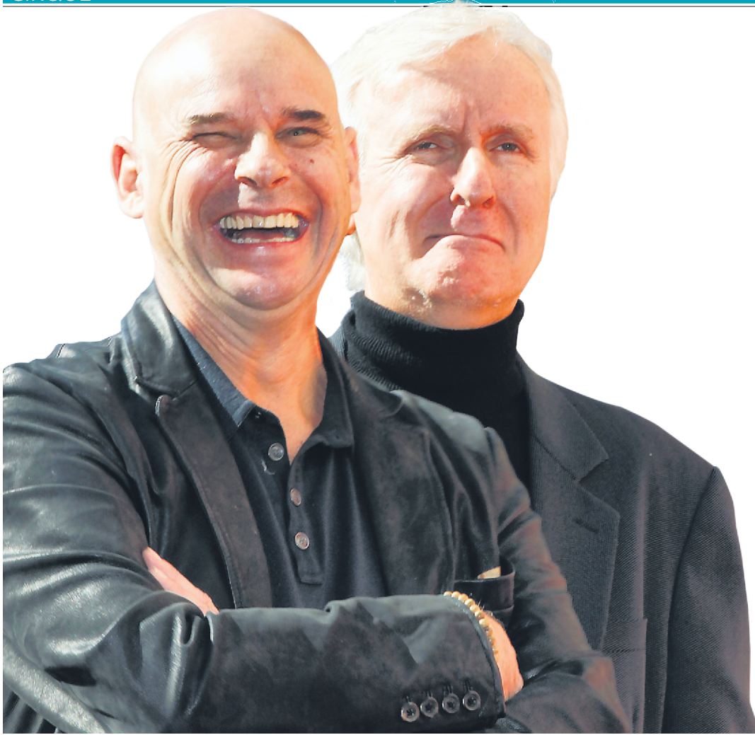
Guy Laliberté et James Cameron.