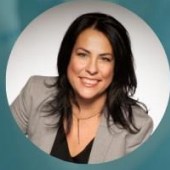
par Nancy Doyon