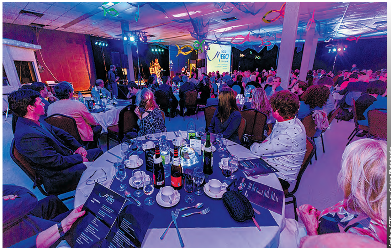
Le dernier gala de la Chambre de commerce de Gaspé remonte à 2017.

En raison de l'absence de gala dans les dernières années, la période de référence remonte à un peu plus loin et se fait à partir du 1 er janvier 2021. Le soir venu, un souper sera organisé, qui sera offert par un consortium de res-