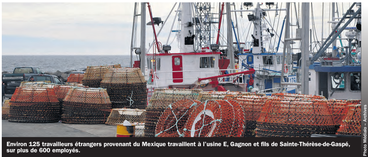
Environ 125 travailleurs étrangers provenant du Mexique travaillent à l'usine E, Gagnon et fils de Sainte-Thérèse-de-Gaspé, sur plus de 600 employés.

Une autre tuile est cependant tombée sur la tête des transformateurs, avec le retour du visa exigé pour les travailleurs