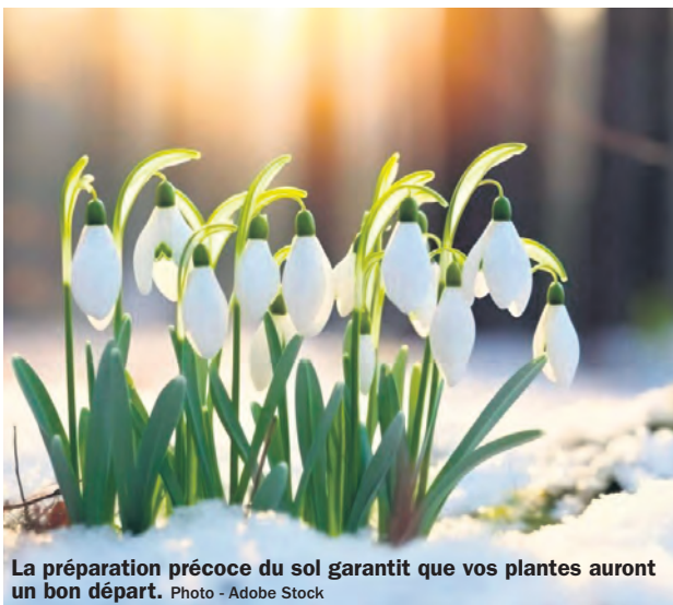
La préparation précoce du sol garantit que vos plantes auront un bon départ.

Entretien et préparation de la piscine pourraient également être nécessaires plus tôt que d'habitude. Vérifiez l'équilibre chimique de l'eau, nettoyez le filtre, et assurez-vous que tous les équipements fonctionnent correctement pour une ouverture sans tracas lorsque le temps le permet.