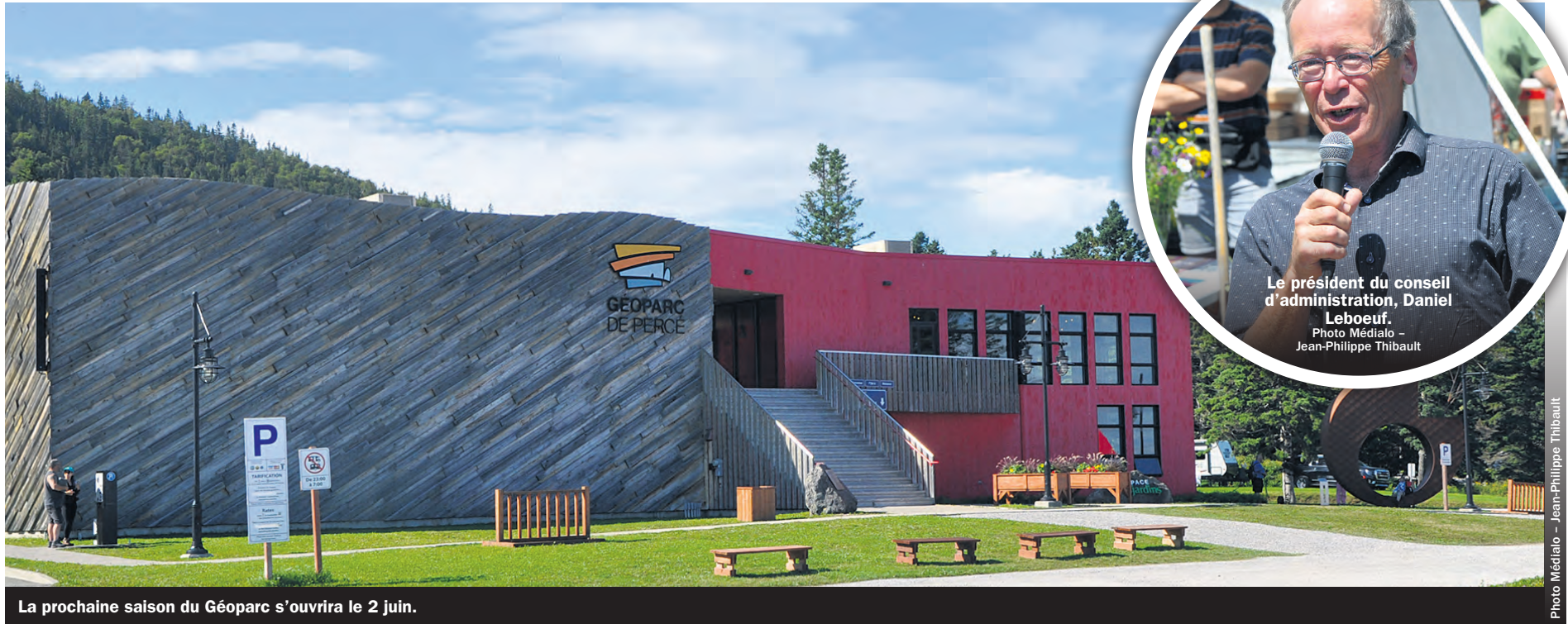
La prochaine saison du Géoparc s'ouvrira le 2 juin.