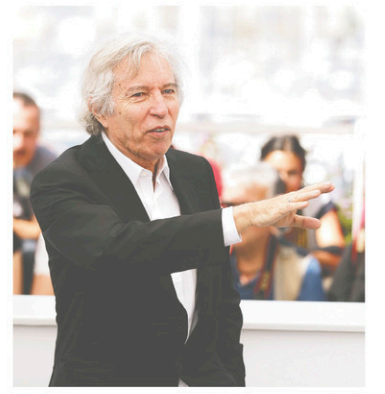
Le cinéaste Jacques Doillon

«C'est un film sur le processus de création», a expliqué Jacques Doillon. J'ai vu trop de biopics où on voyait tout sauf le travail. Par ailleurs, Rodin