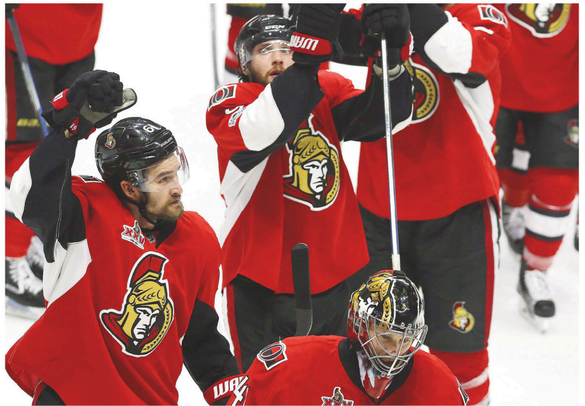
Les Sénateurs ont salué leurs partisans, peut-être pour la dernière fois de cette saison, mardi après leur victoire de 2-1 qui a provoqué la tenue d'un match ultime, jeudi soir à Pittsburgh.

À la suite de leur revers mardi soir, les joueurs des Pen-