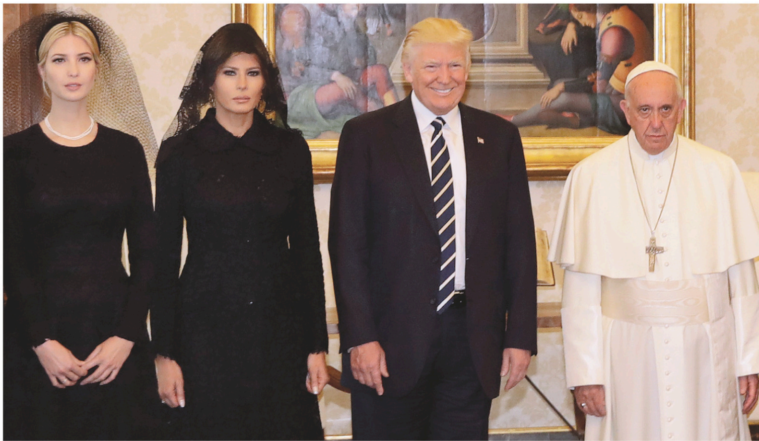
Le président américain Donald Trump a rencontré le pape François en compagnie de sa fille Ivanka et de sa femme, Melania.

Les deux hommes ont aussi échangé sur « la promotion de la paix dans le monde », dont « le dialogue interreligieux » au Moyen-Orient, et Donald Trump a promis d'affecter 300 millions de dollars à la lutte contre la famine.