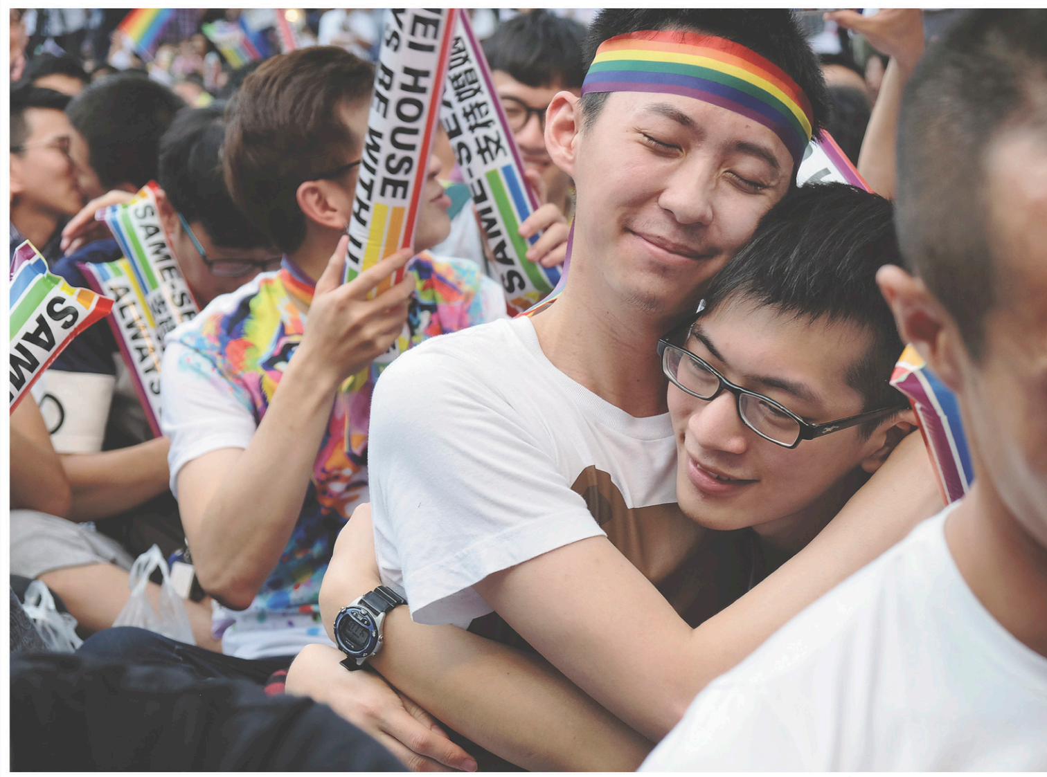
Des centaines de personnes se sont rassemblées mercredi à Taipei et ont bruyamment célébré l'arrêt de la Cour constitutionnelle.