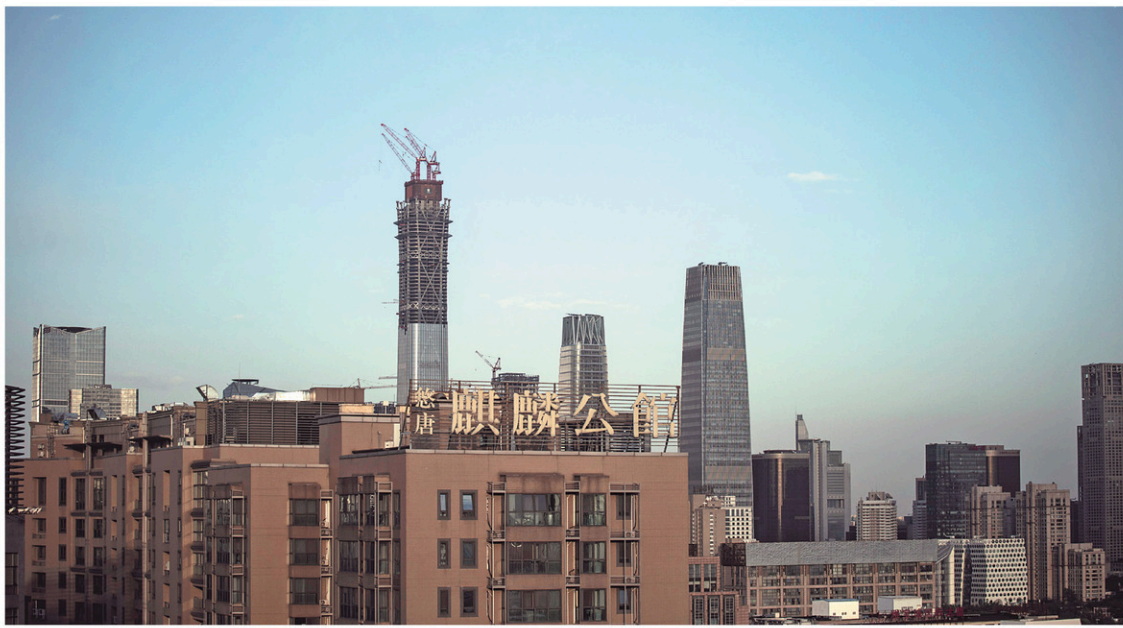
Le FMI a reproché le mois dernier à Pékin de privilégier la croissance à court terme.

En réduisant sa note de «Aa3» à «A1» avec une perspective stable, l'agence a estimé que «la solidité financière de la Chine va quelque peu s'éroder au cours des années qui viennent, le volume total de la dette continuant à grossir tandis que le potentiel de croissance ralentit».