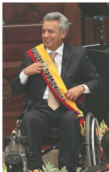
Lenín Moreno a prêté serment devant le Congrès.