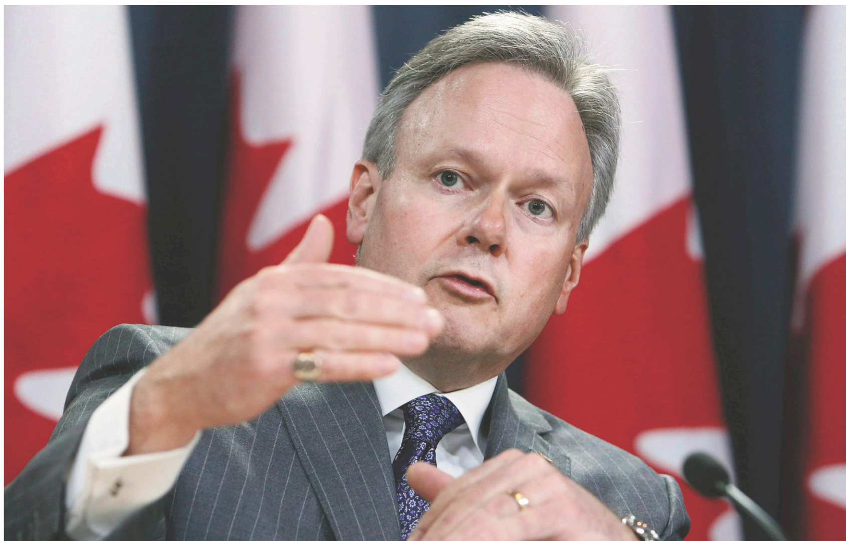
Le directeur de la Banque du Canada, Stephen Poloz