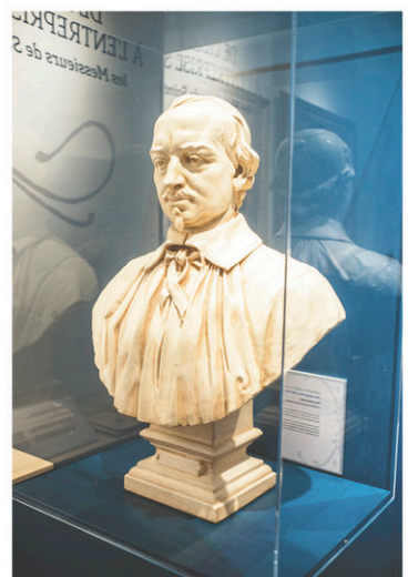
Buste de l'abbé Jean-Jacques Olier, fondateur de la compagnie de Saint-Sulpice