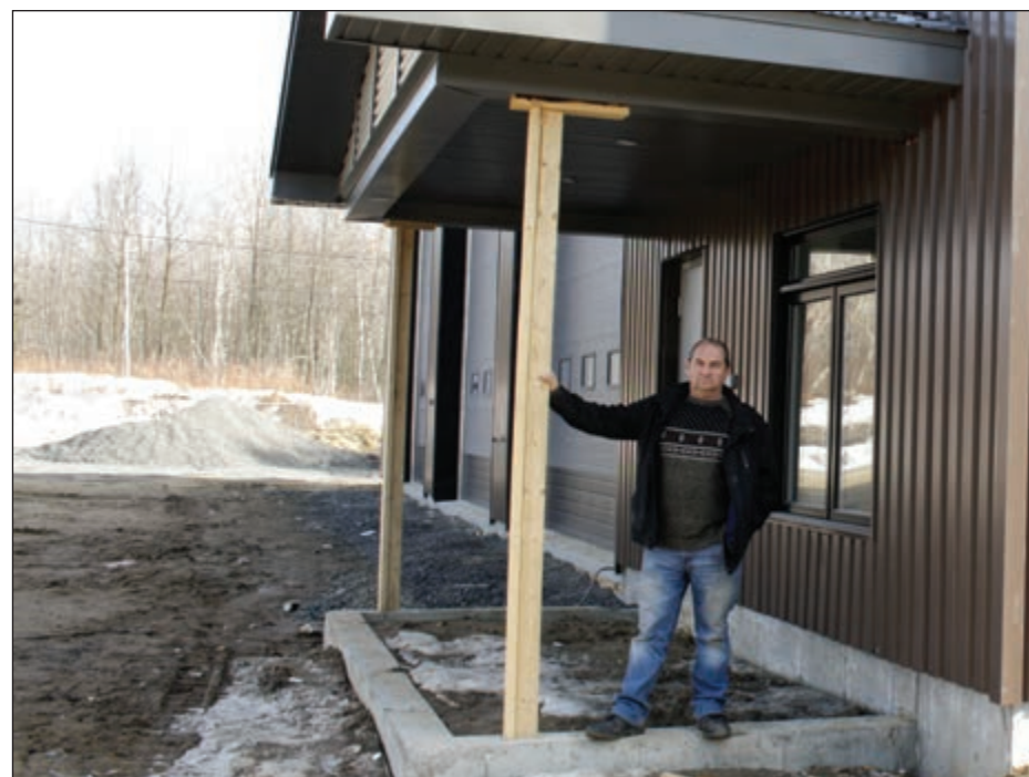
DES INVESTISSEMENTS À ODANAK PAGE 6