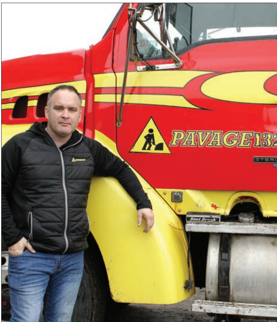
LE PARCOURS D'UN ENTREPRENEUR PAGE 2