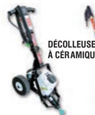
DÉCOLLEUSE À CÉRAMIQUE