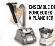
ENSEMBLE DE PONÇEUSES À PLANCHER