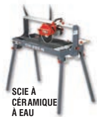
SCIE À CÉRAMIQUE À EAU