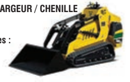
Accessoires disponibles : Creuse-tranchée / Fourche / Tarière