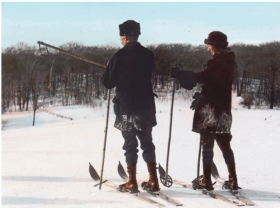
Deux skieurs sur le mont Royal, photographiés autour de 1930