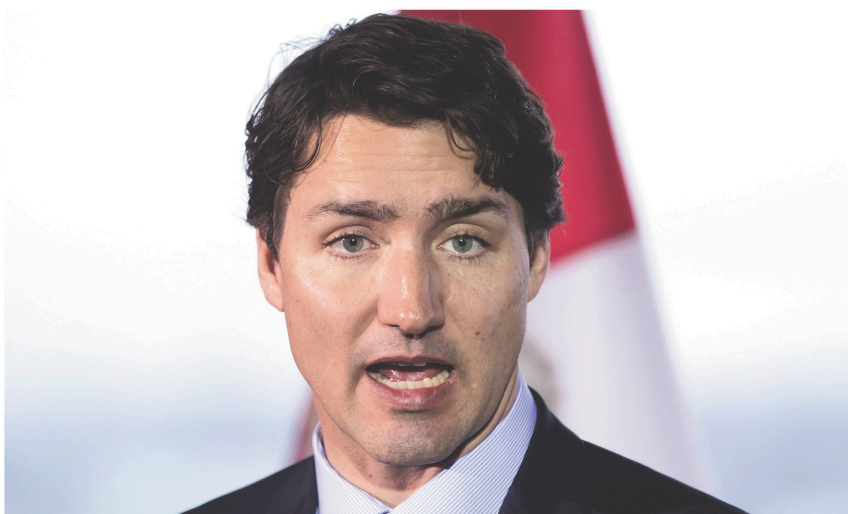
À Vancouver, le premier ministre Justin Trudeau a évité de se positionner d'un côté ou de l'autre.