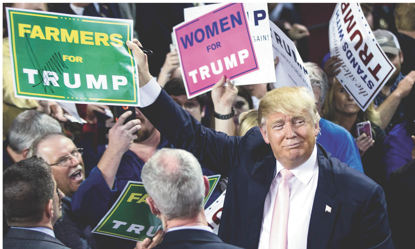
ANDREW HARNIK LA PRESSE CANADIENNE

fpelletier@levoir.com Suivez-moi sur Twitter: @fpelletier1