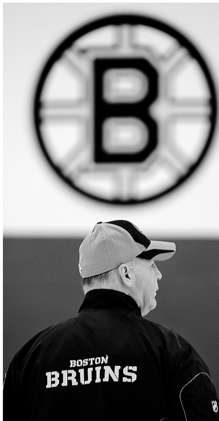
Claude Julien lors d'un entraînement des Bruins, la semaine dernière.

Mais les Canes avaient ensuite gagné les quatre