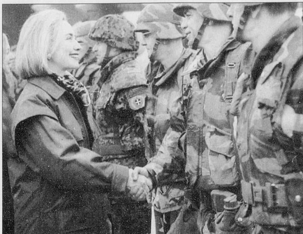
HILLARY CLINTON s'est rendue hier à Tuzla pour une visite aux soldats américains déployés en Bosnie dans le cadre de la force multinationale de paix. Accompagnée de sa fille Chelsea, Mme Clinton est arrivée à Tuzla à bord d'un avion cargo militaire C-130 chargé de cadeaux pour les GI's.