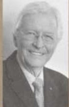
PRÉSIDENT D'HONNEUR JEAN-PAUL L'ALLIER