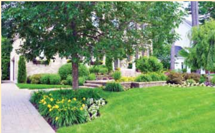
Danielle Fleurant – 24, rue des Talents