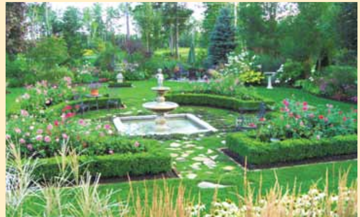
Evelyn Weber – 31, rue de Rochebonne