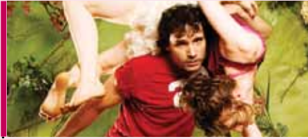
Variation 5 11 novembre – 20 h Théâtre Lionel-Groulx