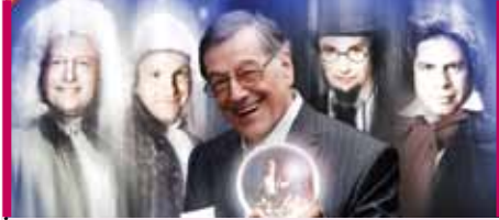
Edgar et ses fantômes 22 et 23 octobre – 20 h Théâtre Lionel-Groulx