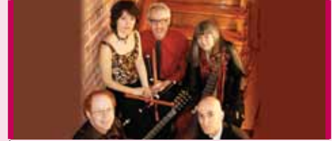
Ensemble Caprice 30 octobre – 15 h Église Sacré-Cœur