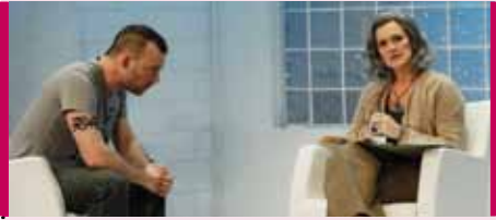
Au Champ de Mars 30 octobre – 20 h Théâtre Lionel-Groulx