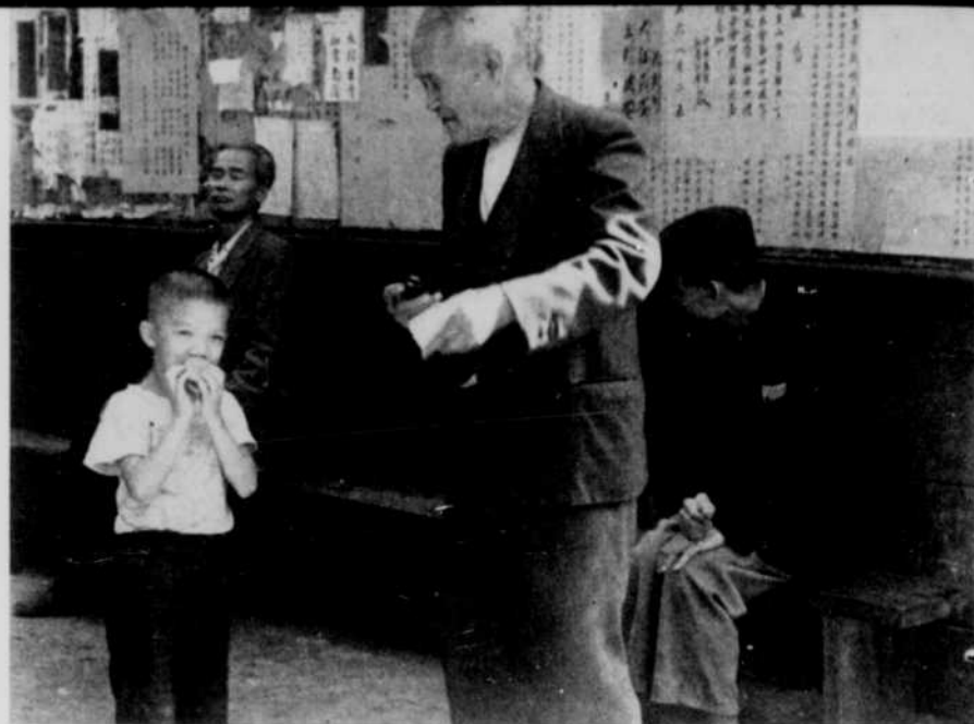
Quel avenir attend ce jeune Chinois qui croque à pleines dents dans son gâteau de riz, encouragé par le sourire de grand-père?