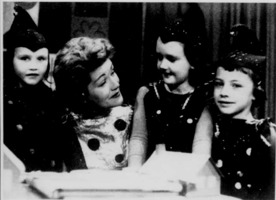
Jaillis tout droit de la Boîte à surprises, ces trois lutins ne cachent pas leur ravissement devant l'histoire que leur raconte la fée Cotillon.

Eurêka passera tous les samedis, de 7 h. 45 à 8 heures du soir, à partir du 16 mai. La réalisation de la série a été confiée à Jean Valade.