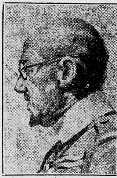
GABRIEL D'ANNUNZIO, le troubadour soldat, qui a provoqué l'épineux incident de Fiume.