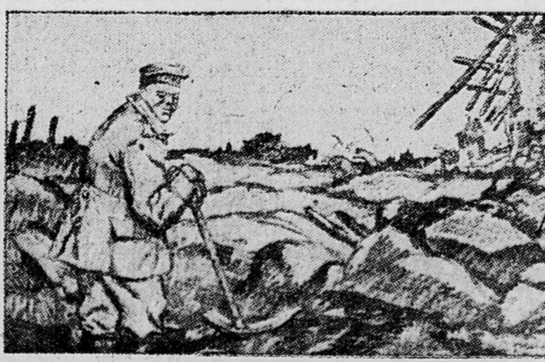
LE BOCHE — "Plus difficile de reconstruire que de détruire."