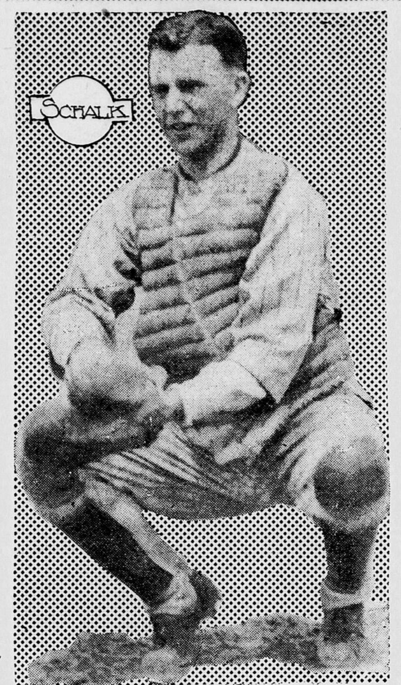
RAZ SCHALK, le fameux receveur des White Sox, a été expulsé de la joute, hier, parce qu'il s'était permis de proférer des menaces contre l'arbitre Rigler après l'avoir bousculé s. v. p. Schalk est une des étoiles de la série.