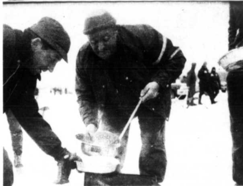
Sur ces photos, on reconnaît le vice-président et quelques directeurs, ainsi que la reine et quelques membres du Club de Chasse et pêche Ambassador, alors que se déroulait le concours de pêche sous la glace. Ce fut un franc succès et on a vu un grand nombre de pêcheurs pratiquant leur sport favori sur la rivière Outaouais. Malheureusement ça ne mordait pas beaucoup et seulement quelques pêcheurs ont pu rapporter des prises à la fin du tournoi. Le tout s'est terminé par un grand souper de fèves au lard servi par l'hôtel Ambassador.