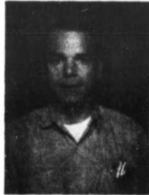
Nous sommes heureux d'annoncer que M.