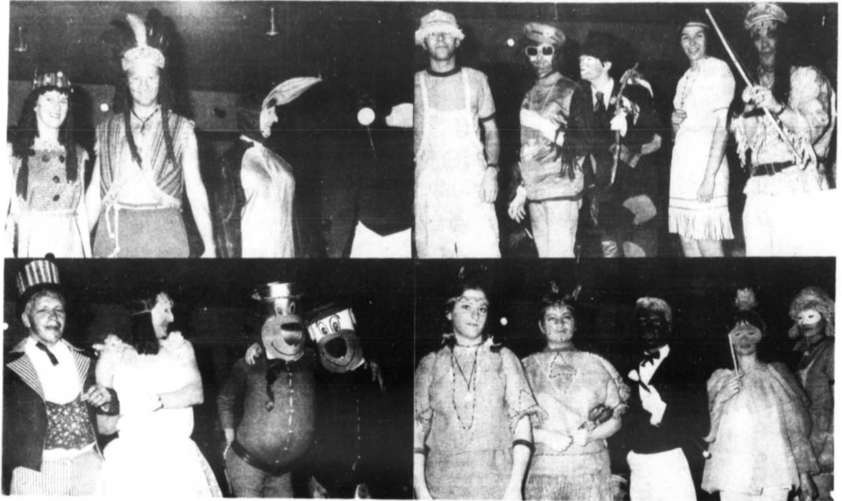
AU BAL MASQUE - Certaines personnes vous reconnaîtrez, certaines autres, vous ne reconnaîtrez pas et nous serions bien embêtés nous-même pour vous donner leur nom, alors, nous vous laisserons admirer les costumes. Ces photos ont été prises lors