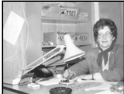
Le bureau des licences