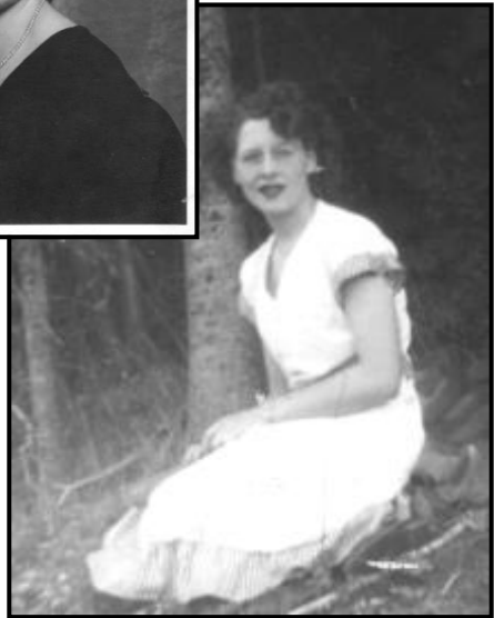
Mes années de jeunesse