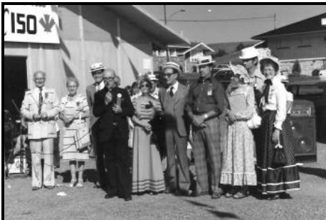
Les fêtes du 150 e de Saint-Fabien. Je suis complètement à droite