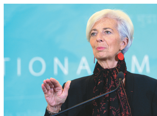
Christine Lagarde, directrice générale du FMI

Des négociateurs parlementaires de la majorité républicaine de la minorité démocrate ont toutefois dévoilé dans la nuit de mardi à mercredi une immense proposition de loi budgétaire qui prévoit entre autres et à la surprise générale, la ratification de la réforme de 2010. Le texte, qui fixe les dépenses de l'État fédéral jusqu'au 30 septembre 2016, doit désormais être soumis au vote des deux chambres d'ici à