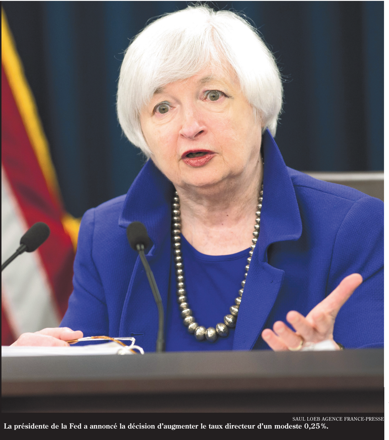
La présidente de la Fed a annoncé la décision d'augmenter le taux directeur d'un modeste 0,25%.

La Fed aura attendu sa dernière réunion de l'année pour arracher son taux directeur de son plancher historique. Mais Janet Yellen ne s'en cache pas : la remontée sera lente.