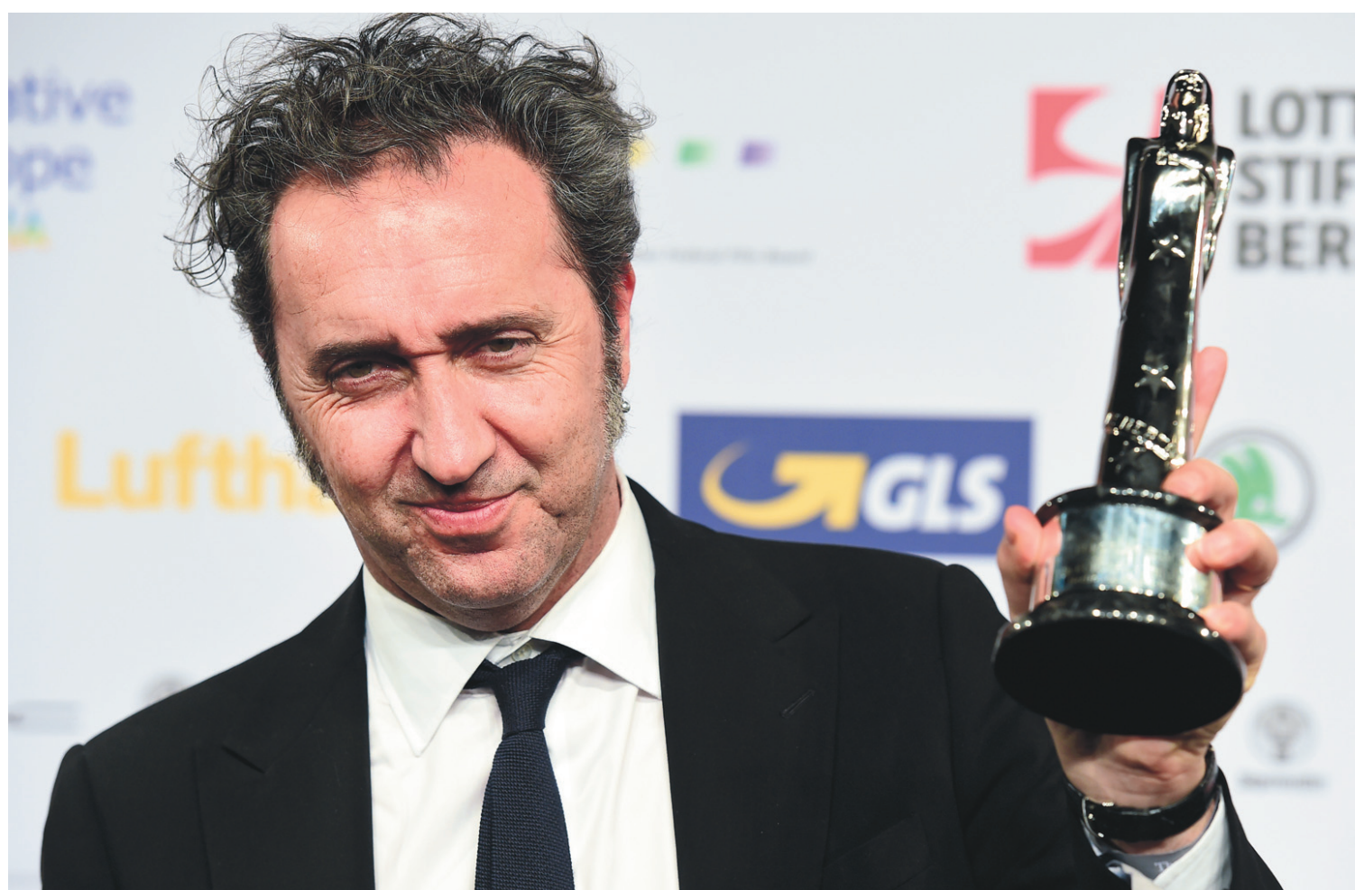
Paolo Sorrentino recevant récemment le prix du meilleur film européen pour Youth , mettant en vedette Harvey Keitel et Michael Caine

Youth est le second film en anglais du cinéaste d' Il Divo , après It Must Be the Place en 2011, road movie américain d'une ancienne rock star gothique mettant en scène Sean Penn, boudé quant à une distribution grand