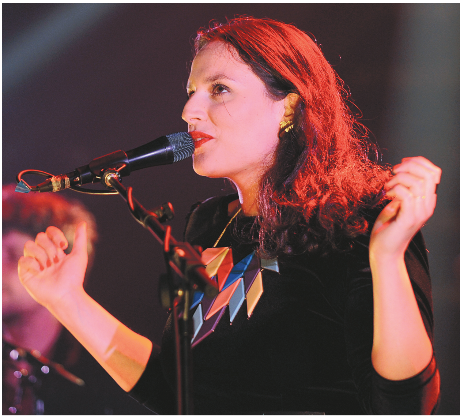
Anna Chedid en spectacle au Festival de Bourges plus tôt cette année