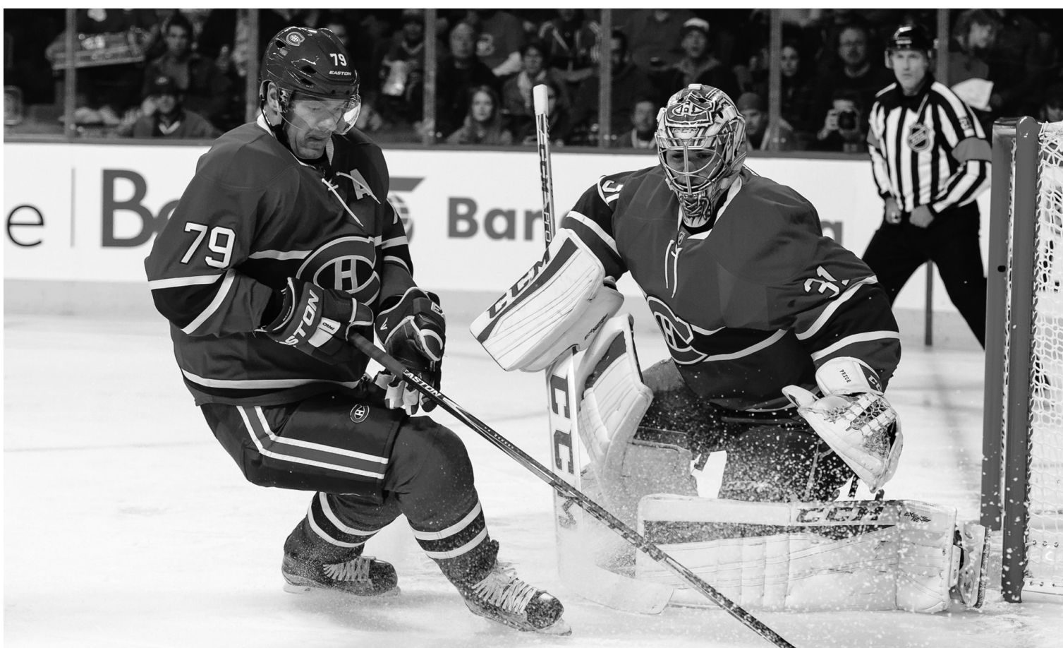
Andrei Markov jouera avec Tom Gilbert.