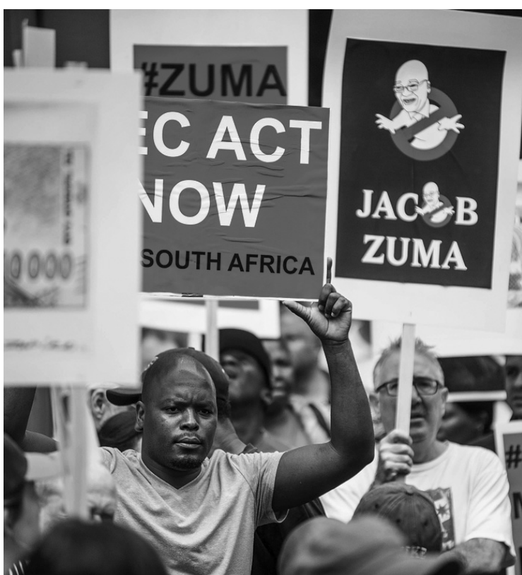
Des Sud-Africains de toutes les classes sociales en ont ras-le-bol du président Zuma.