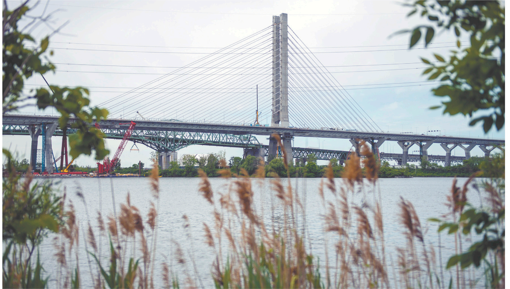
Le pont Samuel-De Champlain crée un lien routier des plus novateurs entre l'île de Montréal et les collectivités de la Rive-Sud.

Premièrement , il faut prendre en considération les besoins en matière de mobilité de tous les acteurs présents. Pour garantir une demande suffisante, l'élaboration des services de transport proposés tiendra compte des intérêts des piétons, des cyclistes, des automobilistes, des entreprises de ca-