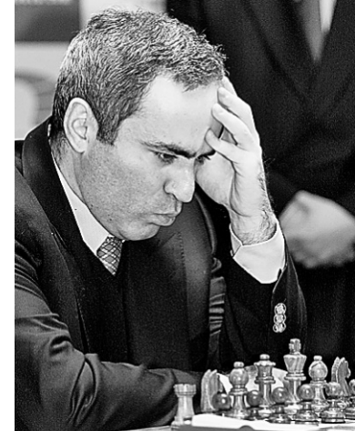
Garry Kasparov

Il y aura 10 ans vendredi, l'ordinateur Deep Blue d'IBM remportait sa première manche contre Kasparov; celui-ci allait finalement gagner le match, sept jours et cinq manches plus tard. Deep Blue se rattrapa lors du deuxième match l'année suivante, devenant ainsi la première machine à battre un champion du monde, selon les règles de temps régulières. Les ingénieurs d'IBM ont travaillé dur pour montrer que la compagnie savait faire des ordinateurs puissants. Deep Blue a été programmé avec de nombreuses constantes restant à déterminer (est-ce qu'un roi en sécurité est plus important qu'un carré central maîtrisé, etc.). Par la suite, il a ingurgité 4000 positions et 700 000 parties de maîtres pour déterminer ces constantes. Deep Blue a été amélioré entre les deux matchs, augmentant sa capacité d'abstraction à 12 demi-mouvements en avant (la norme humaine est de 10). Kasparov s'est d'ailleurs plaint du fait que les ingénieurs d'IBM avaient pris la liberté de reprogrammer la machine entre deux manches, lui permettant de ne pas tomber dans le même piège deux fois.