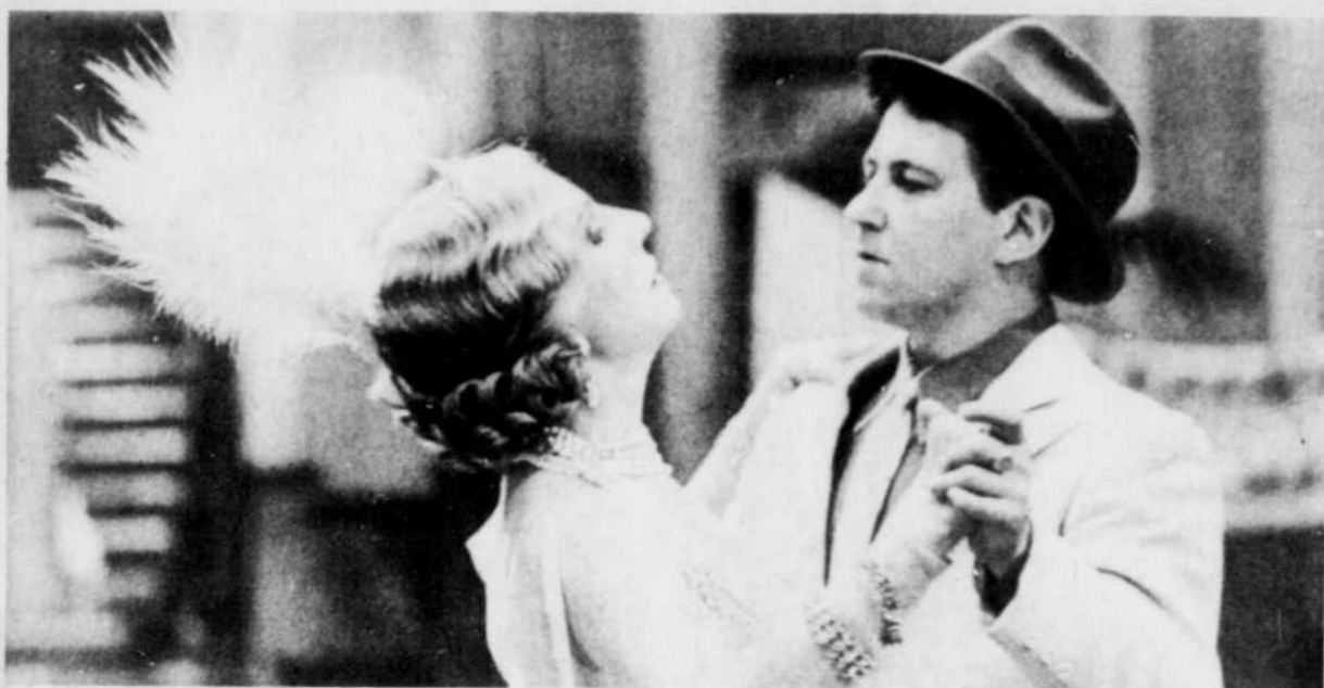
Le Bal, un film d'Ettore Scola.