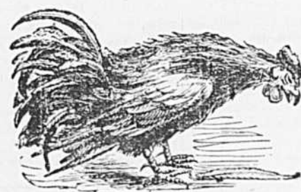
Il pleure la défaite avec envrairie