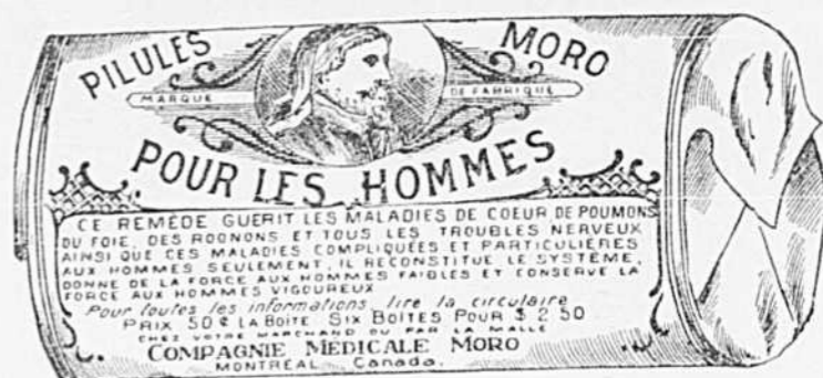
Fac-similé exact d'une boîte de Pilules Moro.

Donnez-nous un homme brisé par les excès, la dissipation, un travail trop dur, les tracas, ou par toute autre cause qui ait sapé sa vitalité, que nous importe quel homme de son âge.