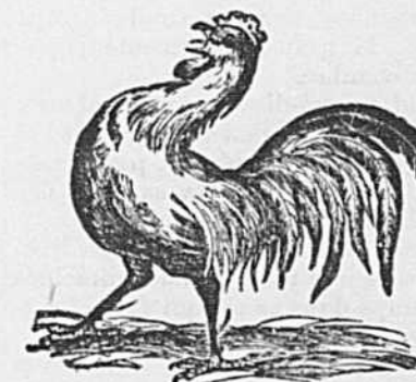
Il chante le triomphe libéral.