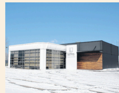
Les locaux de l'entreprise à Louiseville.

Rappelons qu'il y a un peu plus de quatre ans, le fabricant d'armoires de cuisine avait investi près de 1,5 M$ dans le cadre d'un projet d'expansion et d'automatisation de sa production. Le gouvernement avait d'ailleurs accordé des prêts qui totalisaient près de 620 000 $ du Fonds de diversification économique et d'investissement Québec. (POG)