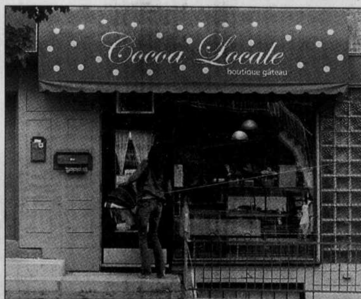
Au cours de la dernière année, trois boutiques, dont Cocoa Locale, ont fait des cupcakes leur vedette.