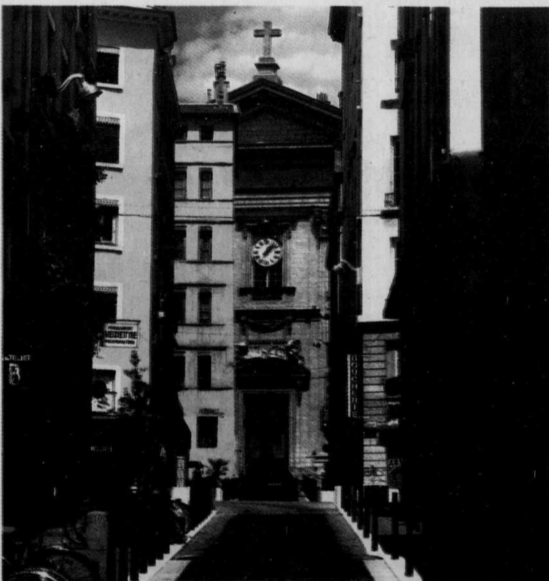
Toute en pente, la Croix-Rousse!