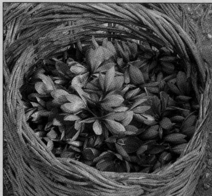
Récolter un kilo de safran équivaut à des journées de travail dans les champs, sous un soleil de plomb.