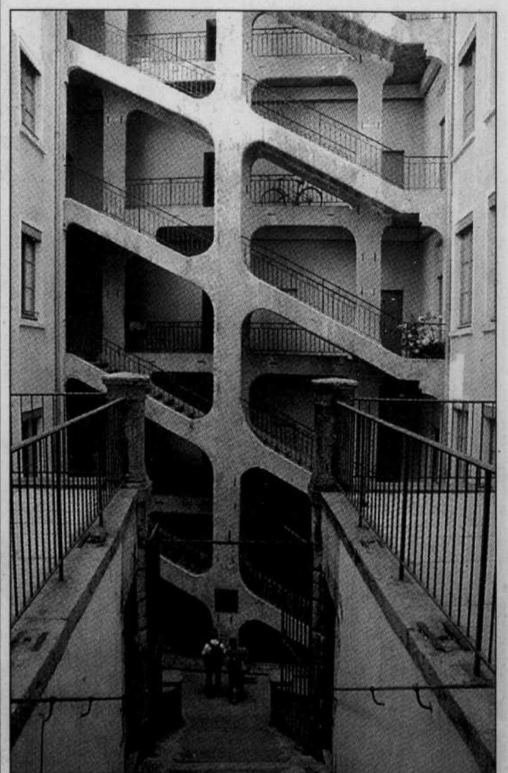
C'est dans la cour des Voraces que se réunirent les canuts révoltés de 1831 et de 1834, «avides» de meilleures conditions de travail.