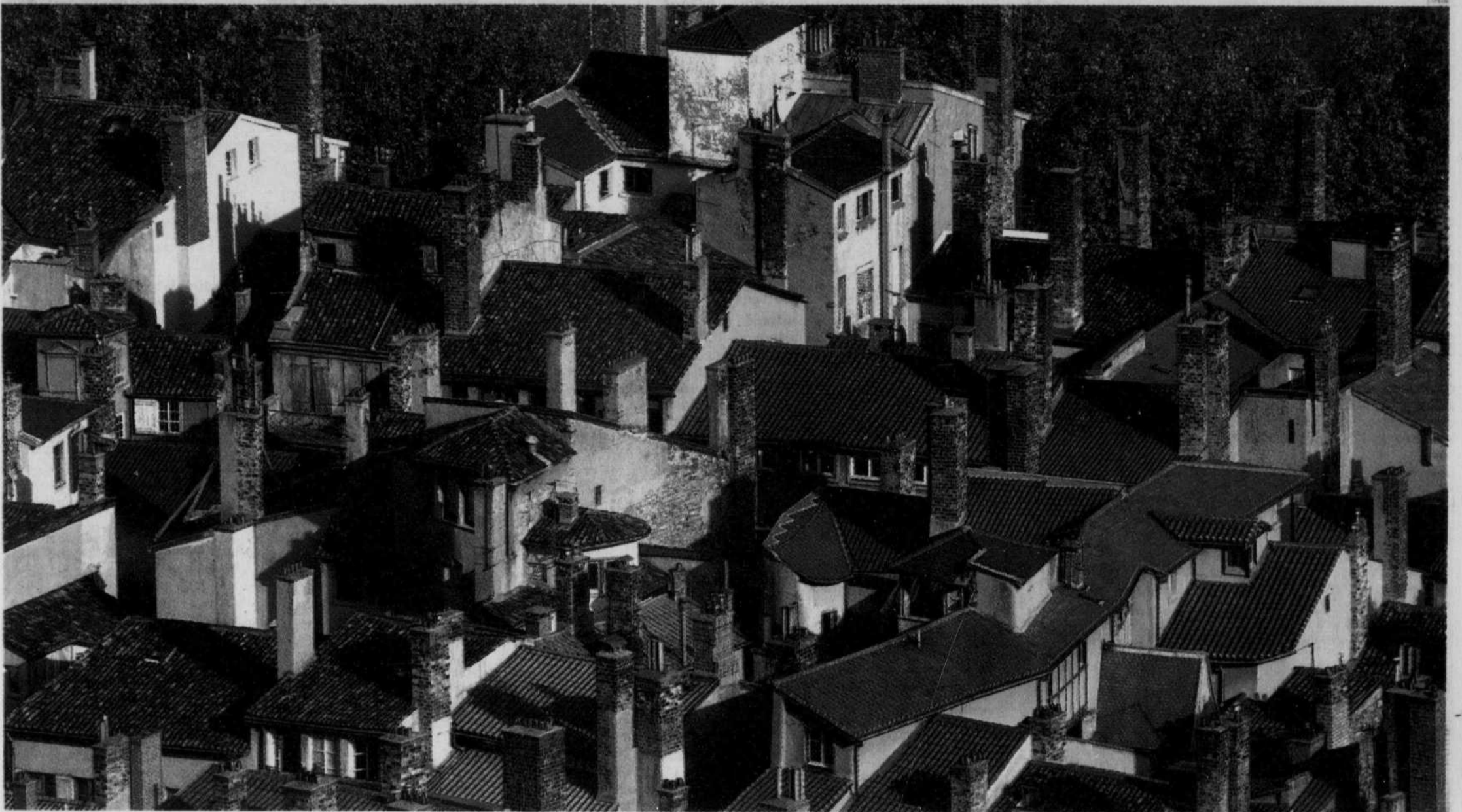
C'est dans le Vieux-Lyon que s'installèrent les premiers tisseurs de la ville.