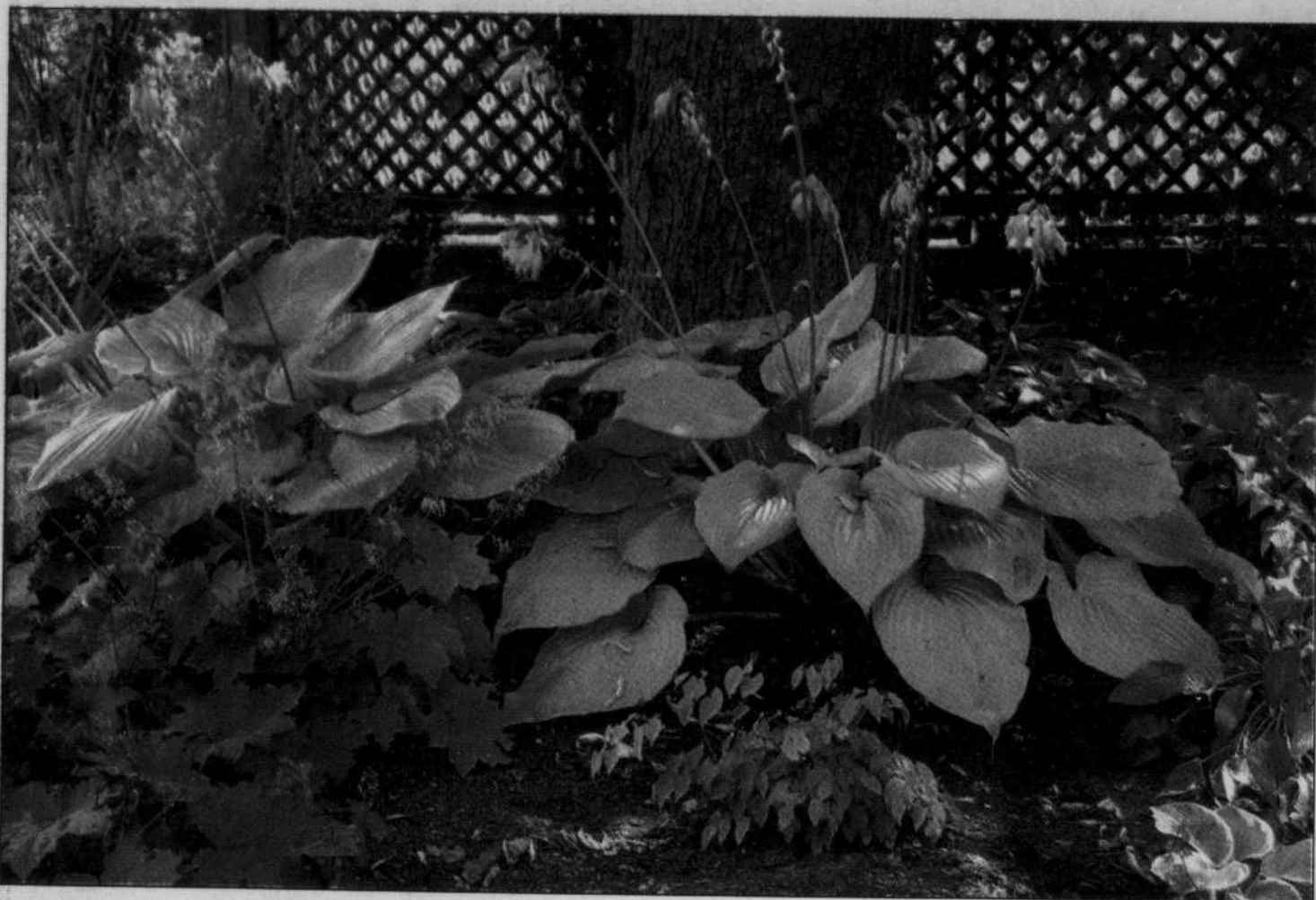
Cette platebande de vivaces a été plantée il y a trois ans. On a retiré la pelouse, déposé sur le sol de cinq à sept feuilles de papier journal, puis recouvert le papier de 20 cm de bonne terre et planté quelques vivaces appropriées: voilà le résultat!

AU FIL DU TEMPS, LE JARDINIER AMATEUR TROUVE QUELQUES FAÇONS DE DÉJOUER LE SYSTÈME RADICULAIRE EXUBÉRANT DE L'ÉRABLE, CET AFFAMÉ QUI S'INFILTRÉ PARTOUT DANS LE SOL À LA RECHERCHE D'INTARISSABLES SOURCES DE NOURRITURE ET D'EAU. QUOI QUE L'ON FASSE, LA LUTTE EST INÉGALE... MAIS NOTRE JARDINIER A PLUS D'UN TOUR DANS SON SAC DE TERRE. VOICI QUELQUES TRUCS ET CONSEILS POUR VOIR GRANDIR VOS PLANTES ANNUELLES.