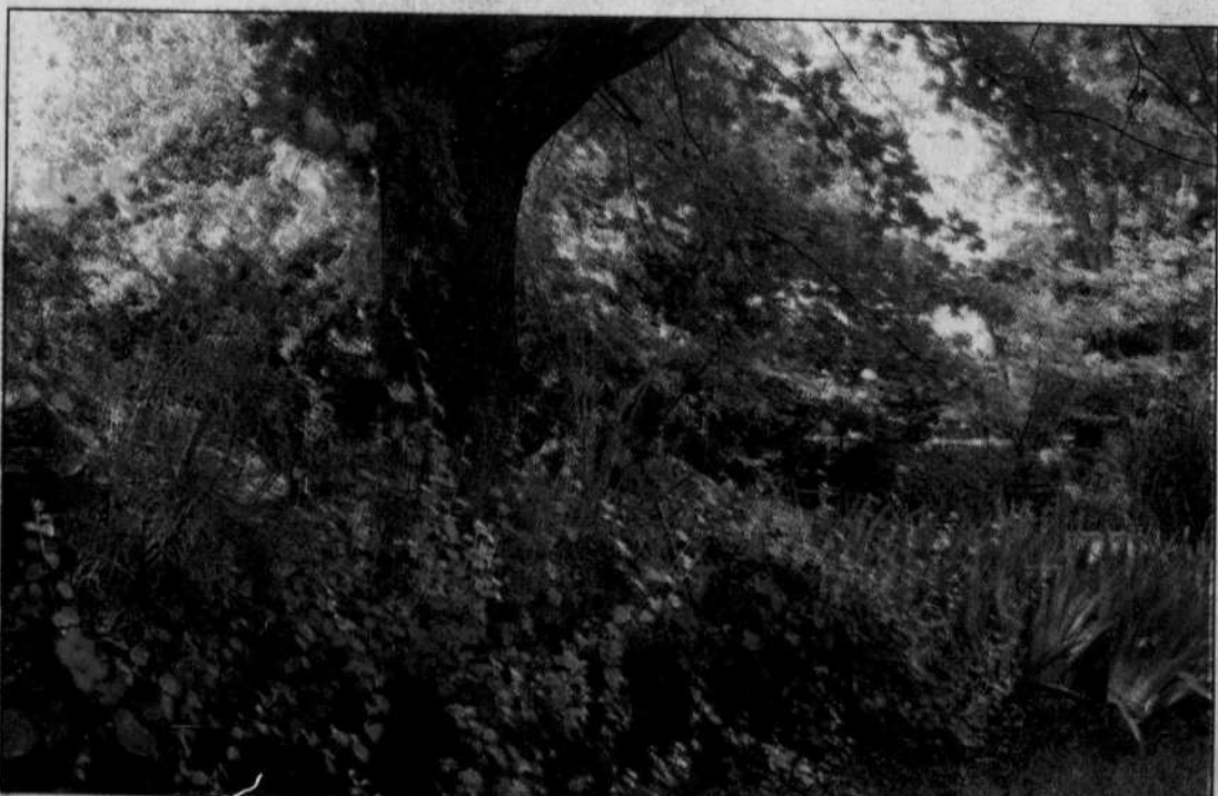
Autre solution: construire des boîtes ayant pour fond un morceau de polystyrène et les garnir de fleurs annuelles.

DEPUIS QUELQUES ANNÉES, les feuilles de mes plants de persil, qu'ils soient d'Hambourg ou de Naples, frisés ou pas, se faisaient toujours dévorer par l'élégante chenille du céleri. Quelques graines d'aneth échappées de culture et produisant des plantes à un endroit non désiré, proche du persil, ont survécu grâce à la bienveillance du jardinier ou, plus justement, à sa négligence. Le fait est que ces grosses chenilles, qui n'ont pas l'art du mimétisme — et c'est tant mieux —, préfèrent se gaver d'aneth, faisant du persil un miraculé! Voilà une plante qui vient d'entrer dans ma liste des végétaux-sacrifices! La diversion fait partie de l'arsenal des techniques culturelles du jardinier. Si vous faites des cornichons à l'aneth, ne semez pas cette plante le jour de la Fête de la reine... C'est trop tôt. Lorsque viendra le temps de son utilisation, il ne vous restera que les tiges abandonnées par les chenilles et quelques graines! Rappelez-vous que l'aneth se sème environ 45 jours avant la mise en conserve des cornichons. La planification fait partie du cahier des charges du bon jardinier!