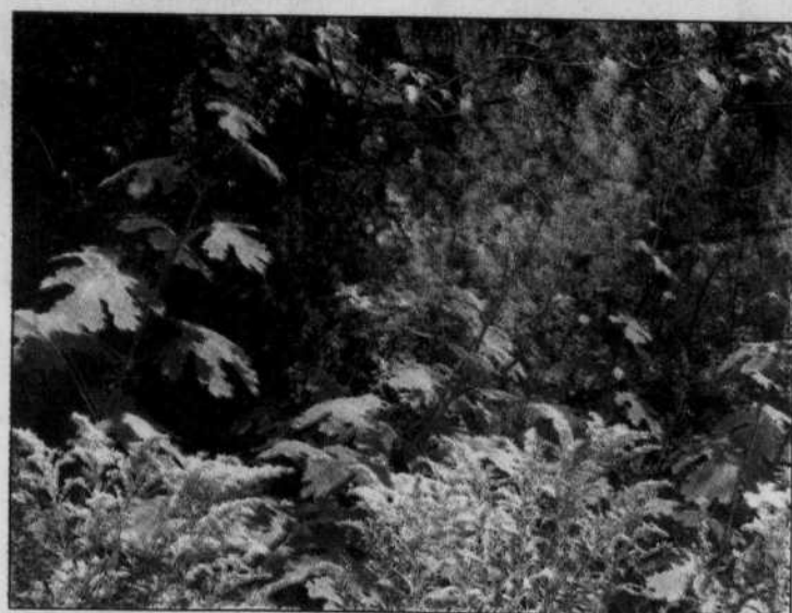
Impertinente Macleaya cordata

Voici comment procéder. Si vous avez un semblant de pelouse sous votre érable, coupez-la le plus court possible. Installez sur le sol de cinq à sept feuilles de papier journal (les magazines importés garnis de photos peuvent contenir des métaux lourds dans l'encre...). Mettez-y quelques cailloux car il m'est arrivé que, la brise venue, Le Devoir prenne le chemin de l'école buissonnière; ou mieux, au fur et à mesure, recouvrez de terre. Généralement six pouces de terre pour les Epimedium , Heuchera , Brunnera , Astilbe , voire huit pouces pour des plantes