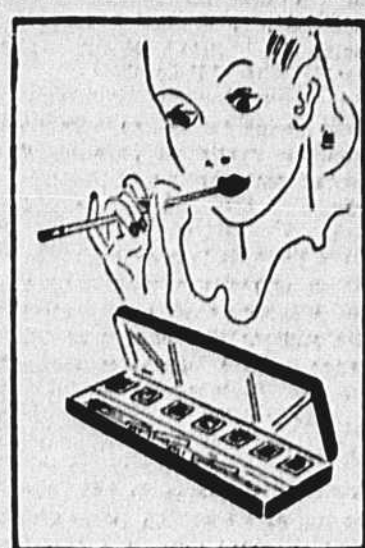
Vous rappelez-vous l'émotion que vous avez donnée votre première boîte de couleurs. Eh bien, en voici une autre qui ne manque pas non plus d'attrait. C'est une boîte à maquillage remplie de rouge, de mascara et de khôl... Il y en a pour vos joues, vos lèvres, vos paupières, vos cils... De quoi vous faire une beauté sur commande!

Pour laver le velours blanc. — Le velours de coton blanc est très joli pour la parure enfantine et pour celle des mamans. Pour nettoyer ce velours, qui demande une irréprochable fraîcheur, il faut se servir d'eau tiède et de savon de Marseille, rincer à l'eau tiède. Repasser à l'envers et dans les deux sens.