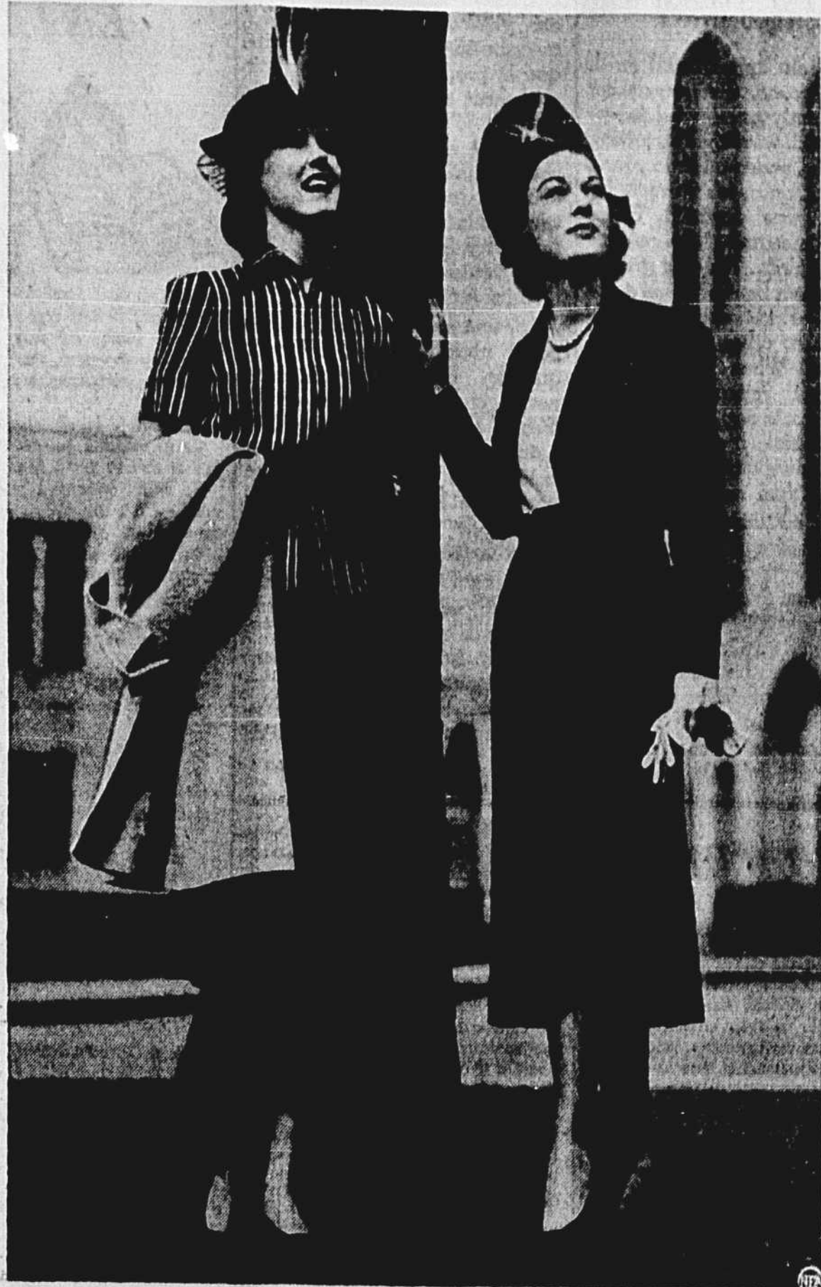
Élégante et pratique pour les jours chauds à la ville, charmante aussi sous un manteau, la robe de soie deux pièces, à gauche, comprenant une jupe noire et une petite jaquette à manches courtes, à raies rouges, noires, vertes et blanches. Un ceinturon noir complète l'ensemble. L'autre création, un costume de laine noire à boléro, convient à n'importe quelle taille. La blouse-veste est d'un beige doré.