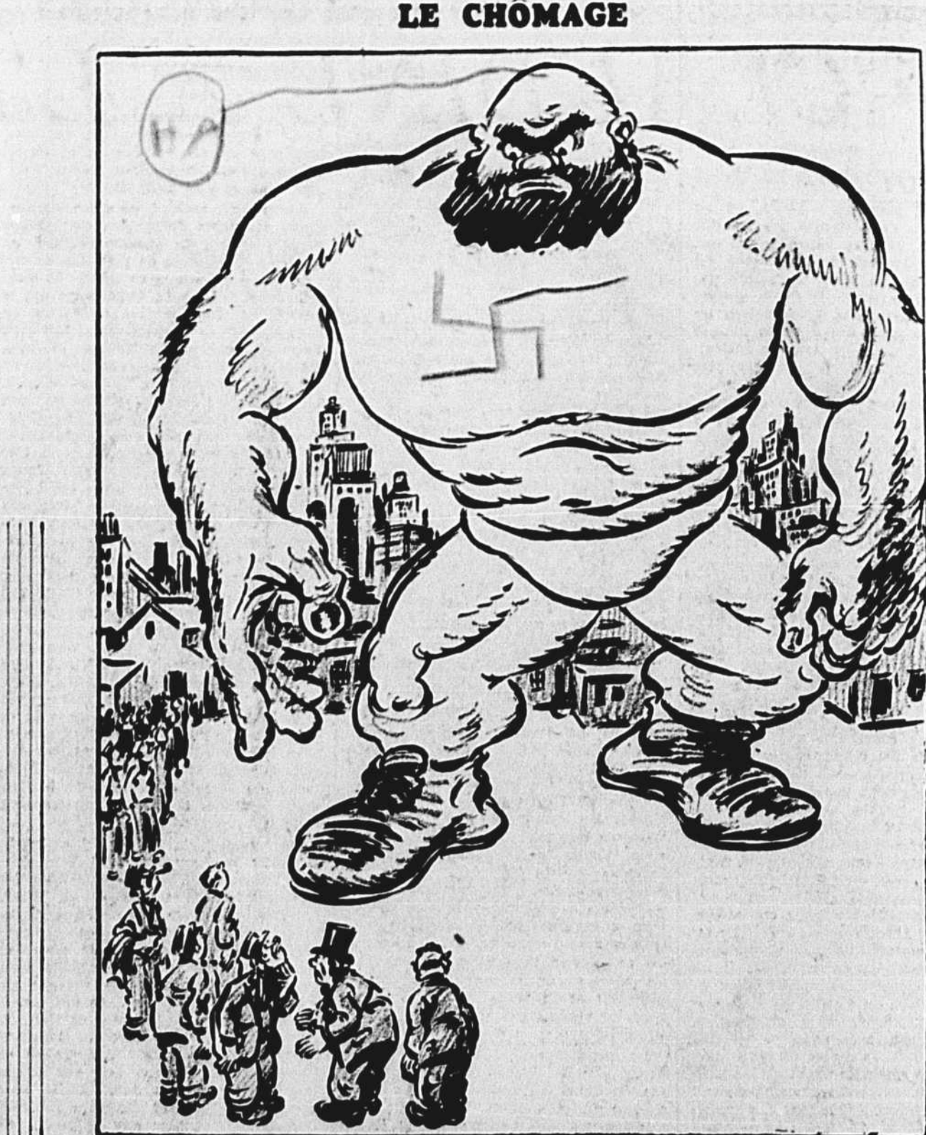
Quel champion invincible

Les recherches relatives à la végétation et aux sujets connexes sont conduites à la station de Petawawa en collaboration avec le Conseil national des recherches scientifiques. (Communiqué du Ministère des Mines et des Ressources)