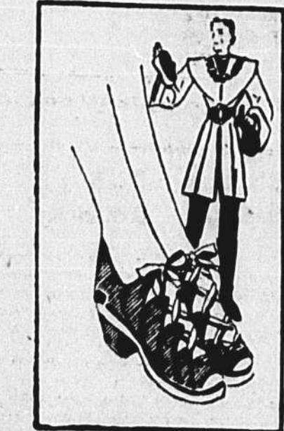
Marco Polo avait dû enfourer dans son sac noir ces sandales à spatules amovibles, lors de sa dernière excursion au Cathy (via le cinéma). Mais Dame Mode les en a sorties et nous avons, comme dernière sensation dans le domaine de la chaussure, ces sandales confortables, aux semelles molles, douces aux pieds, qu'il est si agréable de marcher avec les vêtements de sport, cet été.