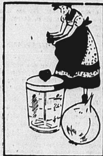
Vous pouvez toujours, comme vos vieilles grand-mères, faire un noeud dans le coin de votre tablier afin de ne pas pleurer en pelant les oignons... Mais il est plus pratique, en même temps que plus moderne, de mettre l'oignon dans ce petit verre, de fermer le couvercle et de faire fonctionner le coupeur... Pas de larmes, ainsi...

Une simple boîte de métal deviendra un joli coffret. Recouvrez-la d'une couche de peinture laque. Faites tailler un verre épais à la dimension du couvercle. Avant de le fixer sur la boîte, vous intercalerez, entre la boîte et le verre, une feuille de papier découpé. Pour découper cette feuille, prenez un carré de papier correspondant aux dimensions du couvercle; rebattez les pointes de ce carré vers le centre, pliez nettement. Vous avez un autre carré à votre disposition en diagonale (portés à l'intérieur). Pliez en deux le triangle obtenu. Vous avez un triangle plus petit que vous pliez de nouveau. Reportez le dessin voulu sur ce triangle en tenant compte du sens de la pliure — et découpez avec des ciseaux pointus et coupant parfaitement. Ceci fait, prenez les découpures et mettez-les en place.