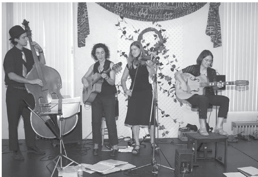
Le groupe de jazz manouche, « Les Imposteurs », invité spécialement pour l'occasion, a ravi les convives.