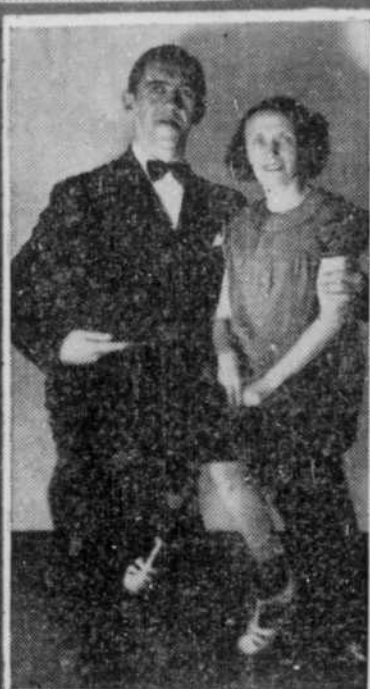
Les deux comédiens irrésistibles de l'Heure des Vedettes Roland BEDARD et Juliette BELIVEAU.