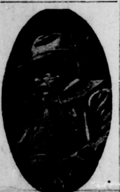
L'ex-président ROOSEVELT, qui critique le programme de paix de Wilson.

New-York. 4.—Teddy Roosevelt, dans une mise au point sensationnelle, a déclaré hier soir que les États-Unis étaient loin d'avoir fait autant que la marine anglaise, et que les armées françaises, anglaises et italiennes pour amener la chute de l'empire allemand. Notre affaire, dit-il, est d'appuyer nos alliés à la conférence de la paix.