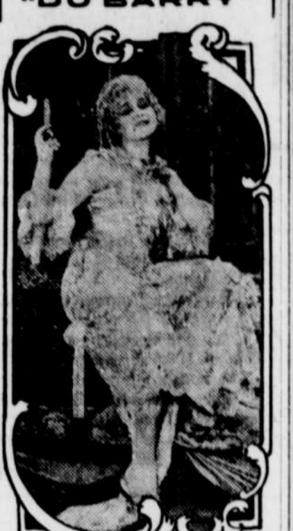
THEDA BARA "AS DU BARRY" WILLIAM FOX PRODUCTION PRIX ORDINAIRES

(The Unbeliever) POUR DEMAIN THEDA BARA DANS "DU BARRY"