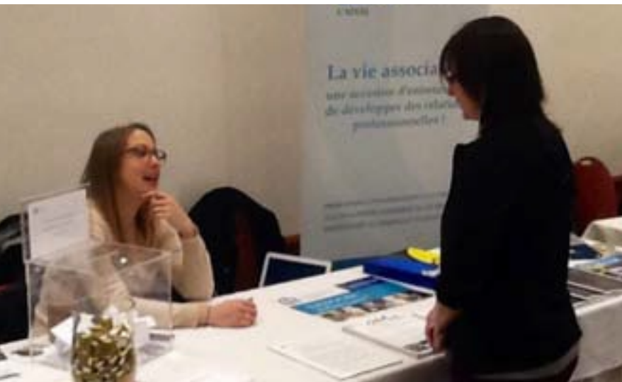
Présence de L'ADOQ au congrès de L'AQIFGA