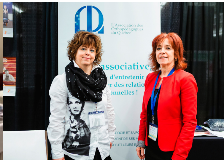
Présence de L'ADOQ au congrès de l'AQETA