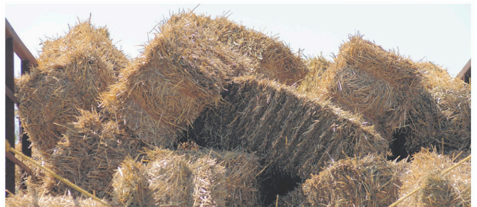
La première récolte de foin a été affectée par les faibles précipitations enregistrées dans la région.

«Effectivement, il y a eu une chute de pommes plus importante due à la sécheresse, confirme Mme Strévey. Mais les arbres ont eu beaucoup de