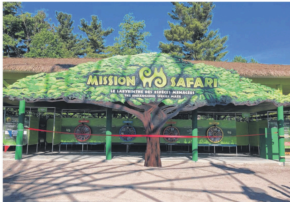
Le Mission Safari attend petits et grands.

«Nous avons des manèges depuis 1974, et la