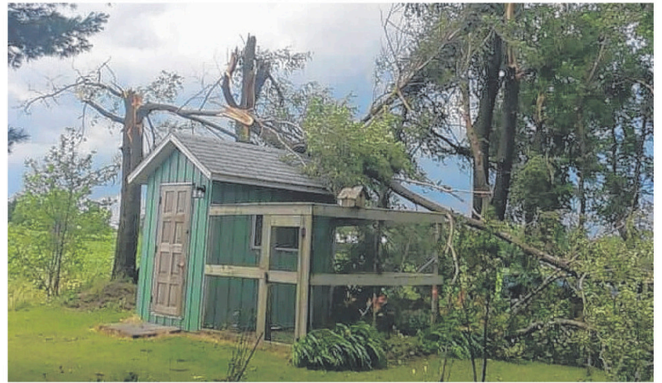
Des arbres cassés par les forts vents.

«On a eu beaucoup de signalements pour cette journée-là, notamment en Estrie, a dit