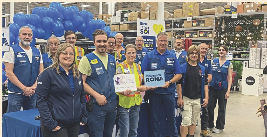
Plusieurs quincailleries Rona de la Montérégie participent à cette initiative.