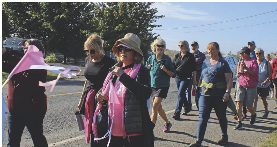
175 personnes ont profité du beau temps l'an dernier pour participer à la Marche pour vaincre tous les cancers.