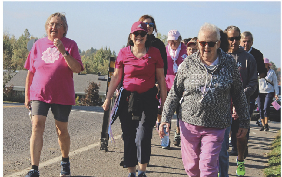
La Marche pour vaincre tous les cancers se tiendra le 6 octobre prochain.

Les organisateurs ont fixé un objectif de 100 000 $ pour cette édition-ci.