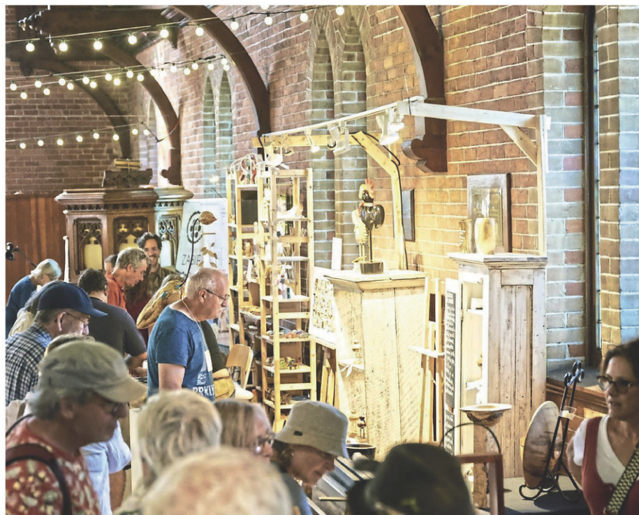
L'église Bishop Stewart Memorial accueillera les 24 artisans du bois présents pour l'événement, les 21 et 22 septembre prochains.