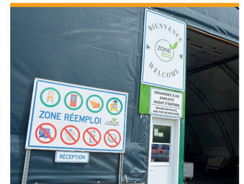
La zone de réemploi de Zone-Éco est l'un des endroits que la population pourra visiter lors des portes ouvertes.