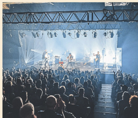
Mich and the Blues Bastards

Le groupe s'est entre autres donné en spectacle sur diverses scènes blues durant les deux dernières années, comme le Festival international de blues de Tremblay, le Saint-Sauveur Blues, Trois-Rivières en