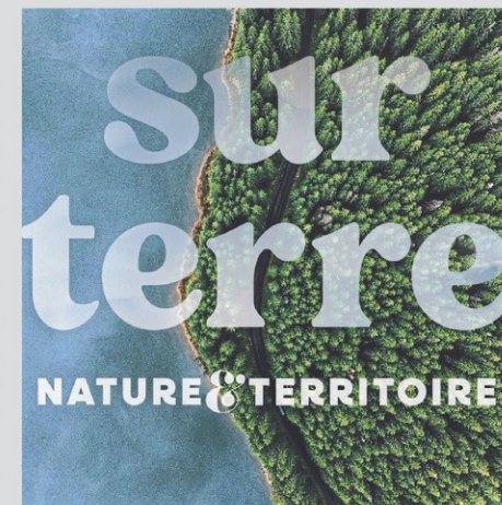
Sur Terre, nature et territoire sera présenté au musée jusqu'à la fin décembre.

L'exposition sera aussi partie prenante de la Promenade des arts et des saveurs de Cowansville, également ce samedi, au parc Centre-ville. Une journée de festivités extérieures est prévue de 10 h à 16 h.