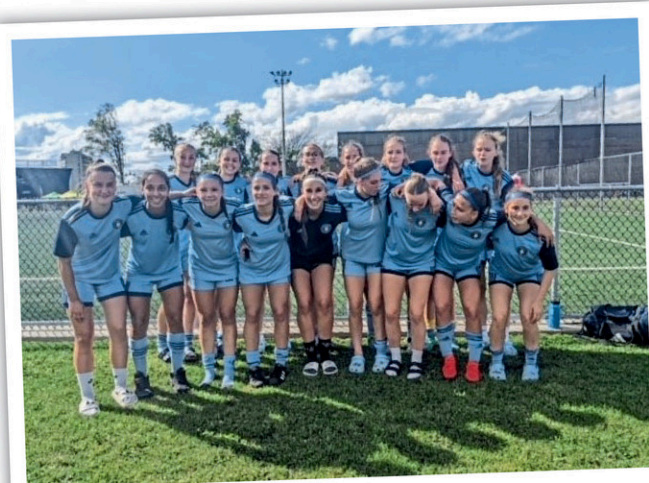
Le Spatial de Saint-Hubert

Ce sont les deux équipes québécoises qualifiées pour les championnats qui croisaient le fer dans la catégorie des moins de 15 ans à Edmonton.