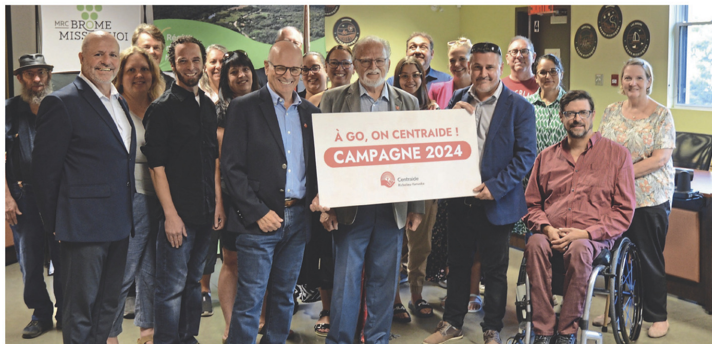
La campagne a été lancée du côté des bureaux de la MRC de Brome-Missisquoi à Cowansville, en présence de plusieurs membres d'organismes communautaires oeuvrant dans la région.

C'est plus de 70 organismes communautaires qui sont appuyés chaque année par Centraide Richelieu-Yamaska.