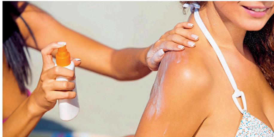
Les crèmes solaires sont développées pour protéger la peau des effets nocifs des rayons ultraviolets du soleil.

Le danger est plutôt de ne pas mettre de crème solaire lorsqu'on s'expose au soleil, selon Michel Alsayegh, président de l'Ordre. « Surtout au niveau des influenceurs où leur public est très jeune. Donc ça peut faire en sorte que ces enfants-là peuvent avoir des coups de soleil et