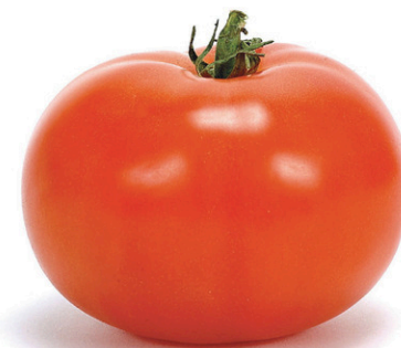
Une tomate rouge moyenne ne contient que 22 calories!

Au marché, à l'épicerie ou directement chez