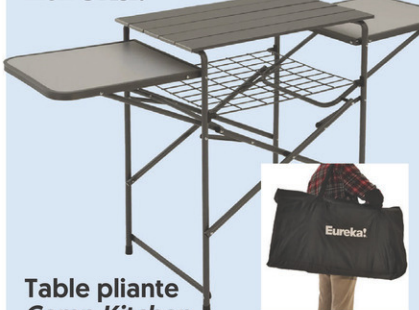
Table pliante Camp Kitchen

Pieds réglables anti-balancement. N° M012137.