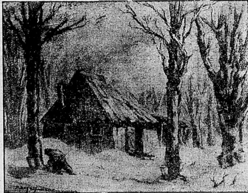
LA CABANE A SUCRE— Ce dessin fait partie d'une série assez importante d'oeuvres de Rodolphe Duguay, actuellement exposées au Syndicat d'Initiative de la Mauricie, rue St-Pierre, face au monument du Sacré-Coeur. Plus de 1500 visiteurs ont admiré ces pièces d'une technique sûre, empreintes de sérénité et toutes marquées d'une forte personnalité. "La cabane à sucre" mérite à elle seule une visite! L'exposition restera ouverte encore quelques jours. Que les amateurs de beauté en profitent!