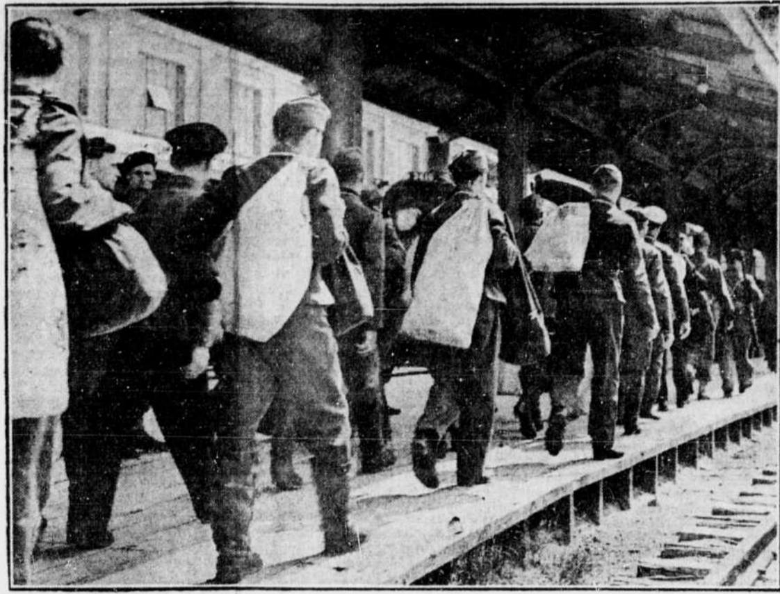
Ce n'était pas encore le pas de l'île qu'on entendait à Québec au débarquement récent de prisonniers Allemands expédiés au Canada mais la démarche tout à fait ordinaire de ceux qui se rendent dans un camp de concentration.

Les Allemands débarquent au Canada mais comme prisonniers