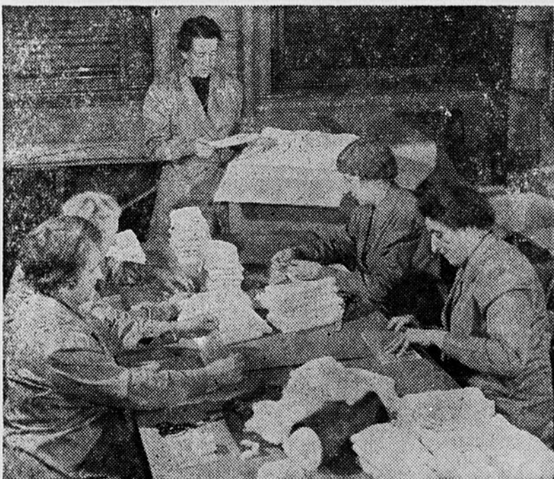
La préparation des pansements chirurgicaux exige beaucoup de soin et d'habileté. On voit ici des bénévoles occupées à ce travail à la Maison de la Croix-Rouge.