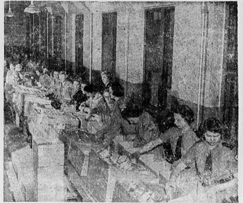
Plus de 47 pour cent du prochain budget de la Croix-Rouge servira à procurer des colis de vivres aux prisonniers de guerre. On voit ici une partie du grand atelier d'emballage de Ville LaSalle, où travaillent des centaines de volontaires.