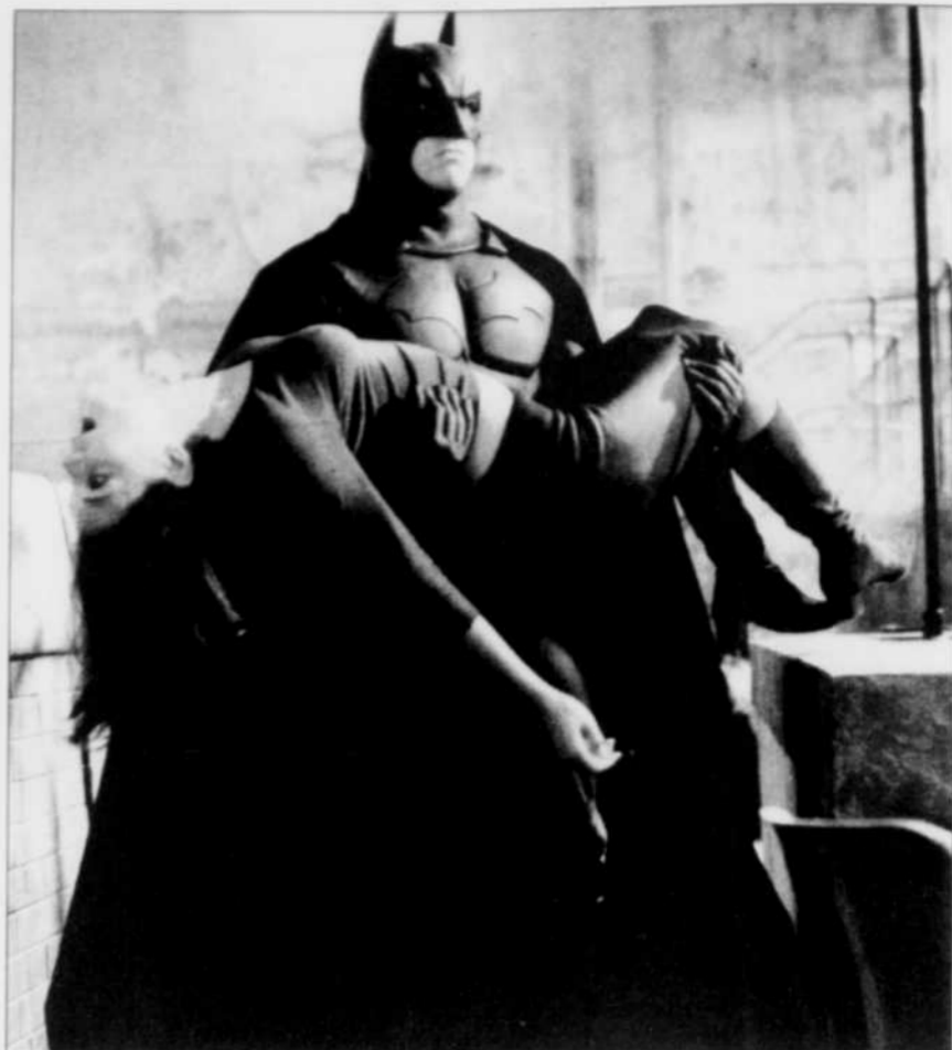
L'homme à la cape au secours de l'héroïne

Le Mal est donc partout. Plutôt que de se concentrer sur un seul vilain, Nolan en fait une force à multiples visages, qu'on découvre petit à petit, telle une poupée gigogne. Il y a le baron de la pègre Carmine Falcone (Tom Wilkin-