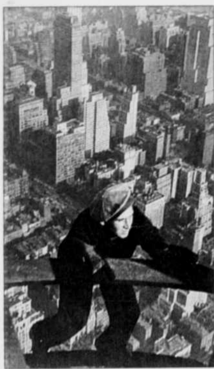
Un ouvrier pendant la construction de l'Empire State Building, en 1931

FRÉDÉRIC BOUDREAU fboudreau@lesoleil.com