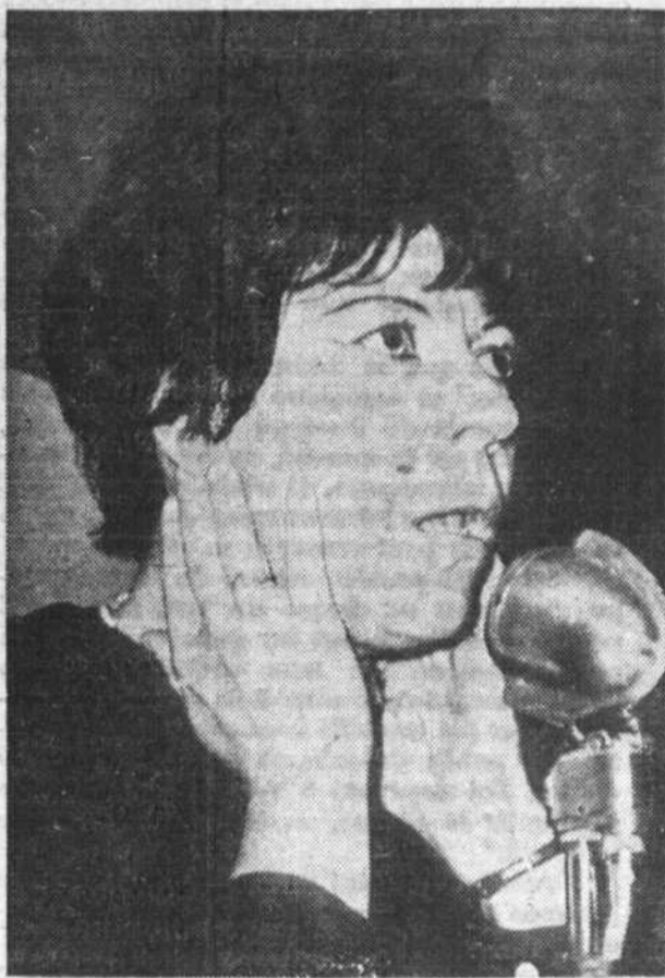
...la voilà pauvre comme Job!