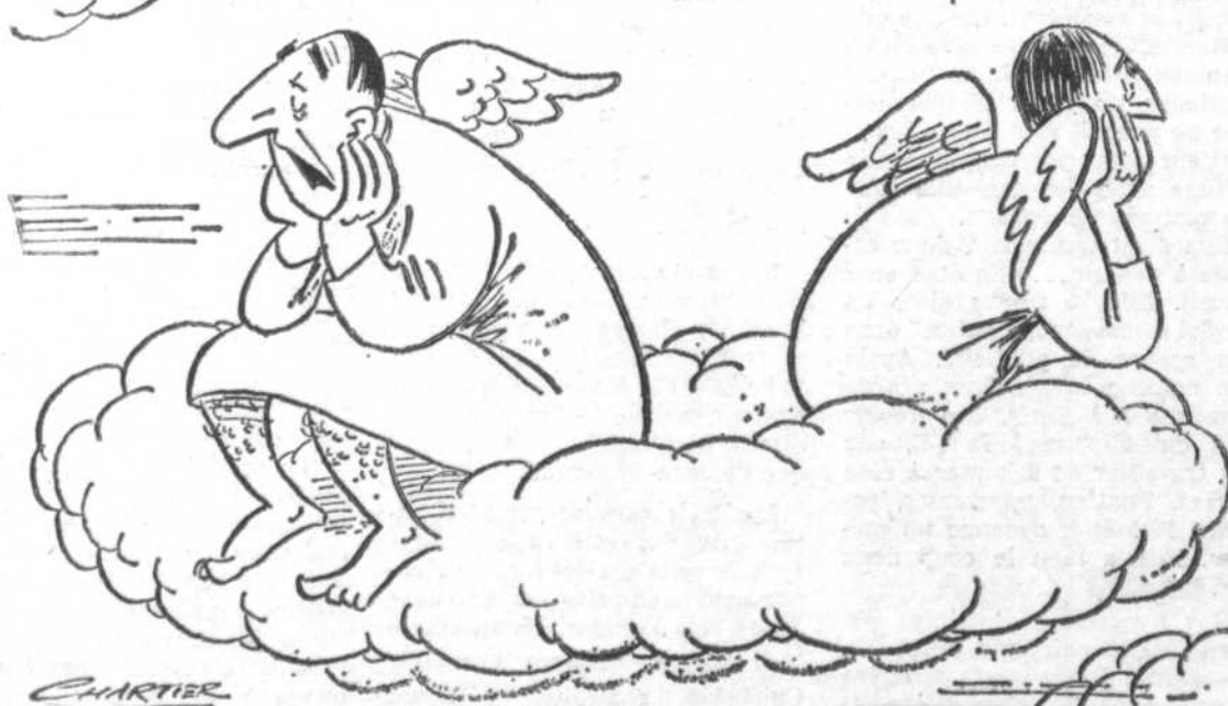
"C'est platte en titi, le matin, sans "Les Joyeux Troubadours!"