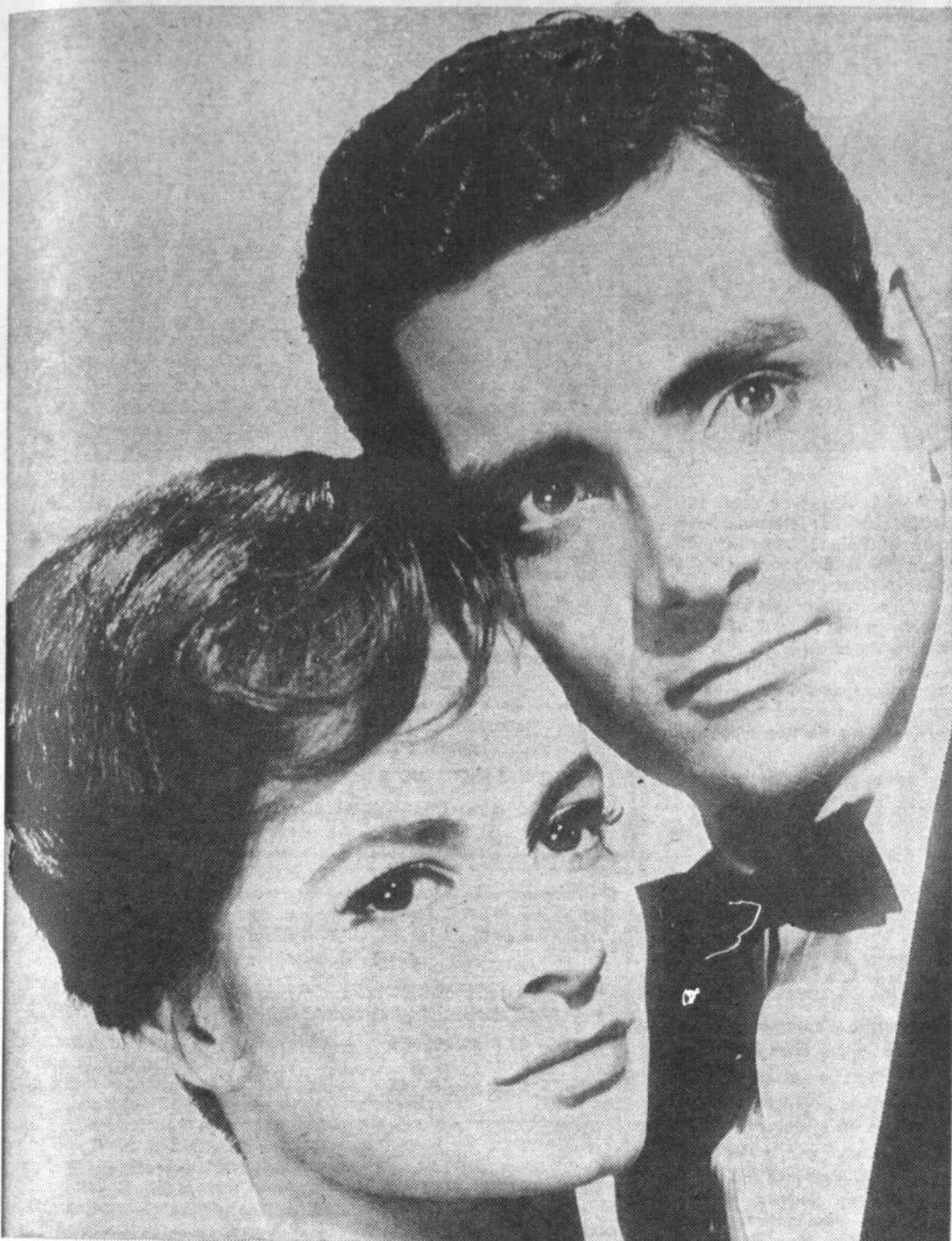
La jolie Luciana Paluzzi et David Hedison sont les deux vedettes de la série policière "La main dans l'ombre", télévisée le mercredi à 11 heures du soir au réseau français et anglais de Radio-Canada. Au cours de cette émission, vous pouvez assister aux aventures extraordinaires d'un agent de contre-espionnage chargé de missions périlleuses.