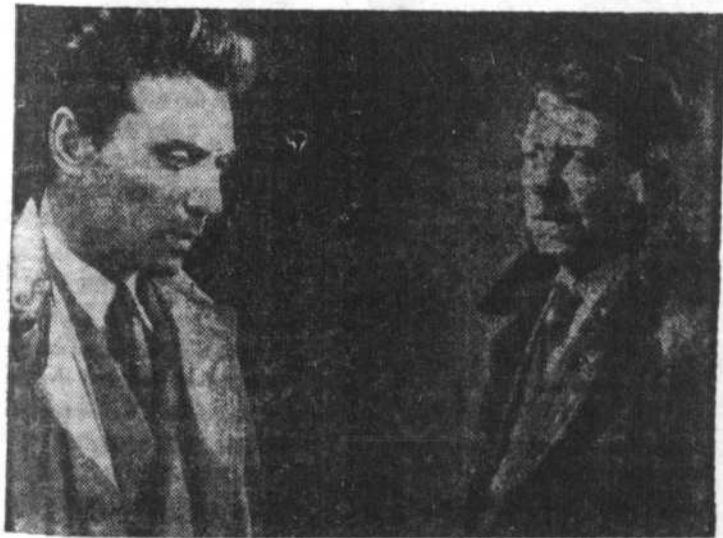
JEAN GABIN et JOSE GUAGLIO dans une scène du film "Le sang à la tête", comédie dramatique qui passera sur le petit écran du canal 10, lundi, le 3 septembre, à 10 h. 55 P.M.