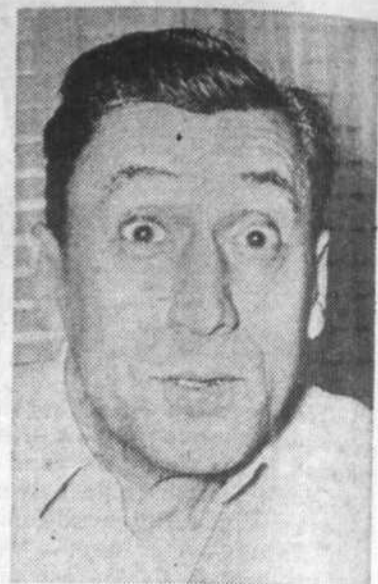
ROGER BAULU ou le frère des autres.

mande: pourquoi ce changement? Sauriez-vous me renseigner? Est-il vrai qu'elle est divorcée d'avec Olivier Guimond (Tizoune)?