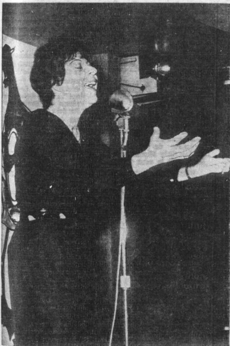
Pour gagner des sous, elle chante.

"Le magicien" est une oeuvre écrite à la demande des Jeunes Musicales du Canada qui l'ont fait entendre à travers le Canada. Ce seront toutefois les premières représentations officielles à Montréal. Ce triple programme d'opéras canadiens clôturera le 27e Festival de Montréal.