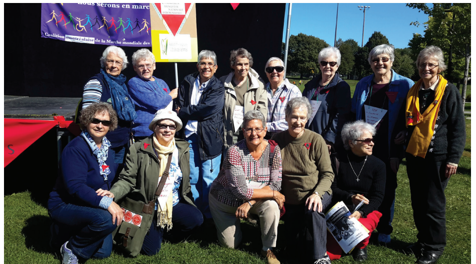
Groupe ARDF - Caravane féministe, Montréal, 26 septembre

Notre première journée de ressourcement prévue pour le 21 novembre prendra la forme d'un panel et aura pour thème : Le dialogue interreligieux entre femmes, un pas pour un meilleur