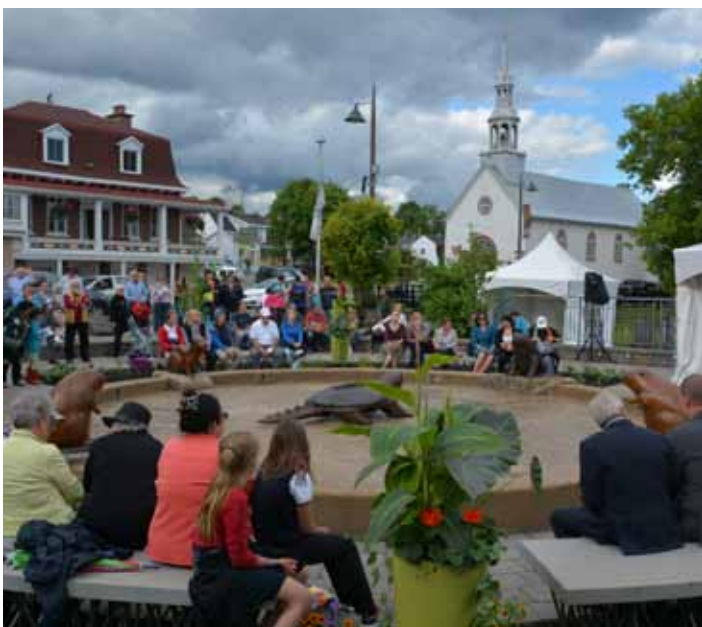
Inauguration de la place Onywahtehretsih le 21 juin 2017

Le 21 juin 2017, l'inauguration de la place Onywahtehretsih (« Nos racines sont anciennes ») se tenait à Wendake. Auparavant connue sous le nom de place de la Nation, cet endroit a été nouvellement aménagé et célèbre maintenant les racines les plus anciennes du pays, notamment en matérialisant dans l'espace public le mythe wendat de la Création. Il inclut, outre un plan d'eau et des végétaux, des bronzes représentant les animaux mythiques du récit, réalisés par l'artiste wendat-abénakise Christine Sioui-Wawanoloath, de même que des bancs-sculptures de l'artiste wendat Ludovic Boney. Une plaque d'interprétation a été dévoilée en présence de plusieurs dignitaires et invités spéciaux.