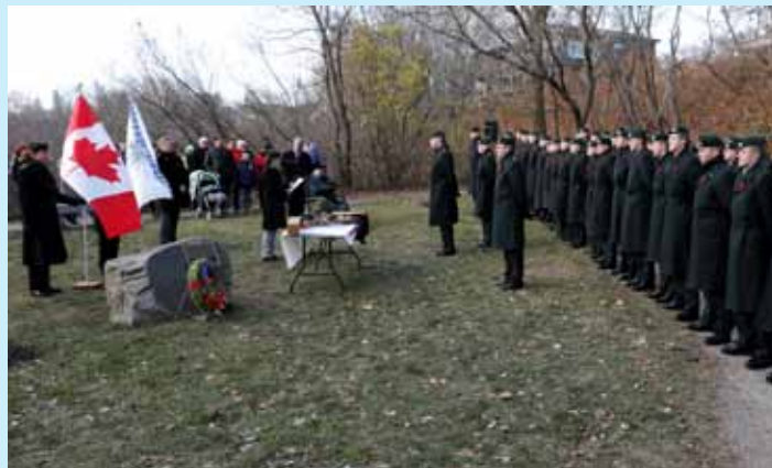
La cérémonie du Jour du Souvenir du 11 novembre 2017 à Wendake

Le 11 novembre 2017, la Nation huronne-wendat a organisé une cérémonie en l'honneur des anciens combattants hurons-wendat et de tous les autres soldats. C'est en présence d'une centaine de personnes que la cérémonie s'est déroulée au parc adjacent à l'amphithéâtre de Wendake. Le 3 e bataillon du Royal 22 e régiment des Forces armées canadiennes était présent cette année, avec 60 militaires. Merci à tous les participants d'avoir honoré la mémoire de ceux et celles qui ont défendu et qui défendent notre liberté et nos valeurs. Vous pouvez visionner une partie de la cérémonie sur la page Facebook « Nation huronne-wendat Wendake ».