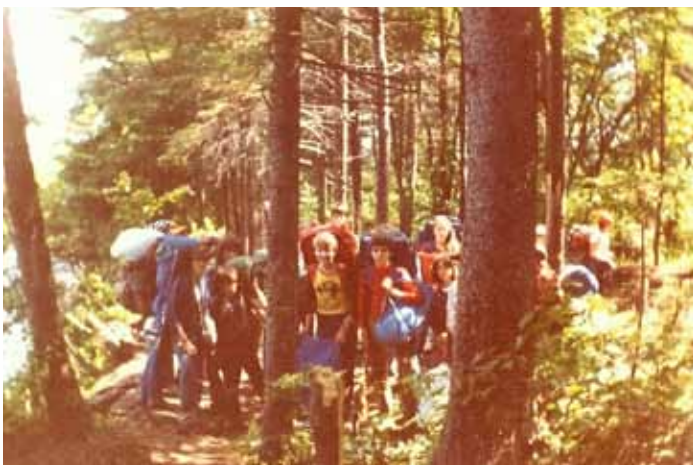
Un groupe du « Plein air » en camping