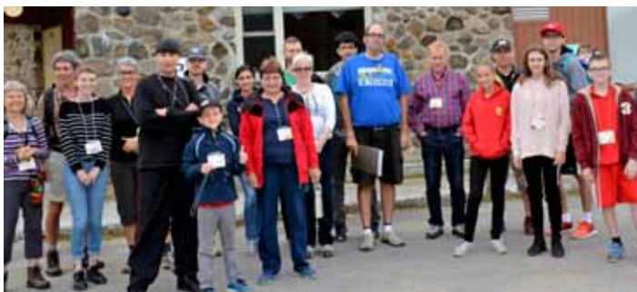
Un groupe de participants qui ont pris part à la randonnée pédestre à la Chute Noire