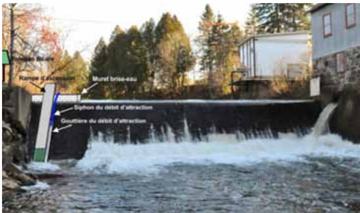
Exemple d'aménagement d'échelle à anguille sur un barrage

Malheureusement, les populations d'anguille dans le bassin hydrographique du fleuve Saint-Laurent ont connu un déclin important au cours des dernières décennies. L'anguille d'Amérique a même obtenu le statut d'espèce sauvage menacée de disparition, en mai 2012, décerné par le comité sur la situation des espèces en péril au Canada. Elle est aussi inscrite sur la liste des espèces susceptibles d'être désignées menacées ou vulnérables par le gouvernement du Québec.