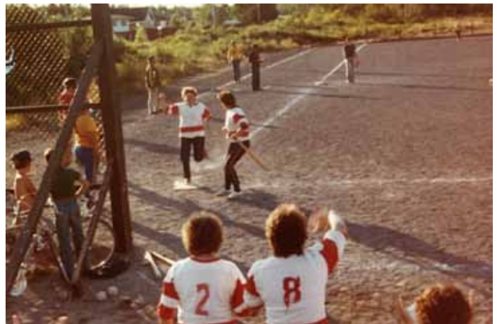
Une équipe de balle