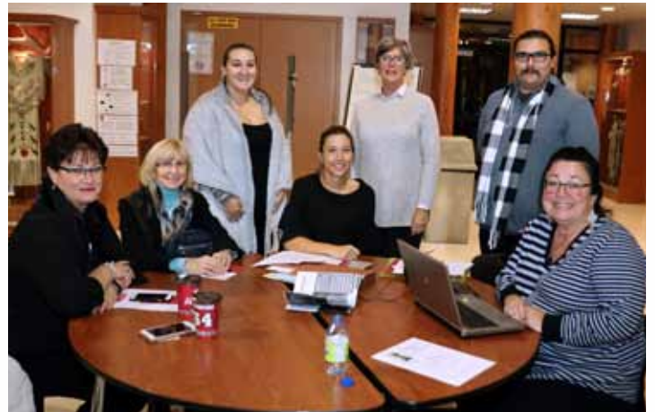
Le Conseil des femmes huronnes-wendat réuni le 2 novembre 2017 au CDFM

Le 2 novembre 2017, avait lieu, au CDFM huron-wendat, une rencontre du Conseil des femmes huronnes-wendat. À cette occasion, le comité a choisi les déléguées de la Nation participantes au rassemblement des Nations, organisé par Femmes Autochtones du Québec, qui avait lieu du 10 au 12 novembre 2017 à Sainte-Adèle.