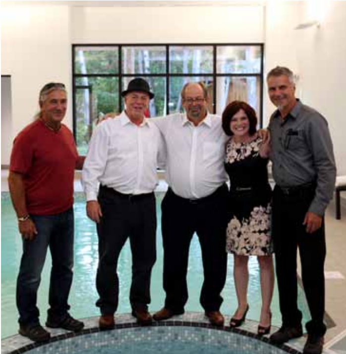
Inauguration de la nouvelle piscine à l'Hôtel-Musée Premières Nations