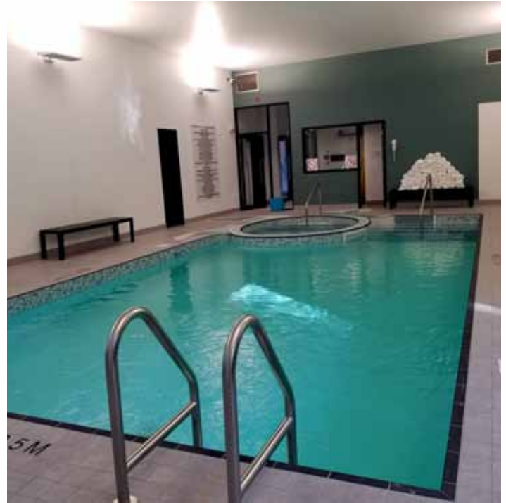
La nouvelle piscine