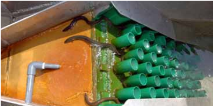
Une échelle à anguille

Le Bureau du Nionwentsïo est fier de s'impliquer au rétablissement d'une espèce traditionnellement importante pour les Hurons-Wendat, et de contribuer à la conservation de la biodiversité et de l'intégrité écologique sur le Nionwentsïo.