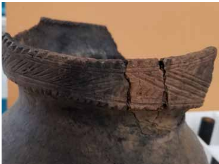
Le col des céramiques sera particulièrement étudié dans le cadre de cette recherche, car l'on y retrouve plusieurs motifs, formes et caractéristiques significatives. Le vase sur la photo est d'origine huronne-wendat

Le projet vise aussi à comparer les techniques de fabrication des vases en céramique des Hurons-Wendat et des « Iroquoiens du Saint-Laurent ». Cette rencontre permettra aussi aux chercheurs et étudiants d'amorcer des échanges et d'éventuelles collaborations sur cette thématique.