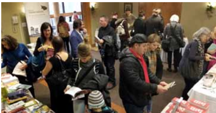
La foire des éditeurs