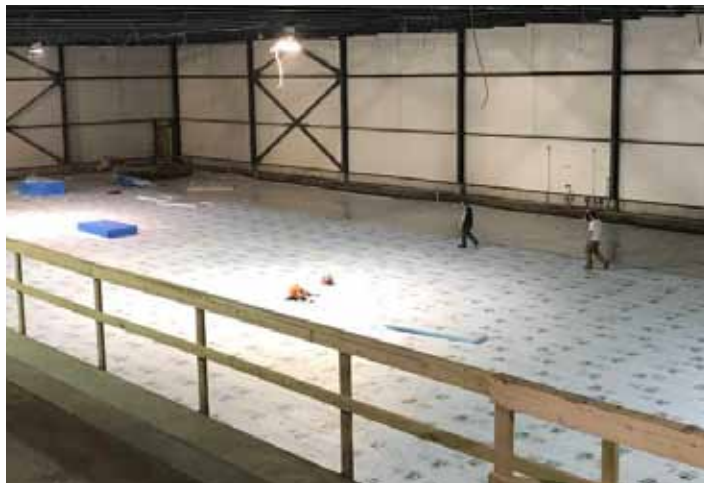
La future glace du Complexe sportif de Wendake

Les travaux en cours sur le chantier du futur complexe de Wendake se déroulent selon les délais prévus. L'ouverture officielle aura lieu en février 2018 avec la présentation des matchs des Pee-Wee du Carnaval de Québec. « La location d'heures de glace va bon train et notre service des Loisirs prépare des activités sportives sur glace et hors glace dans notre salle multifonctionnelle » a déclaré le Grand Chef Konrad Sioui.