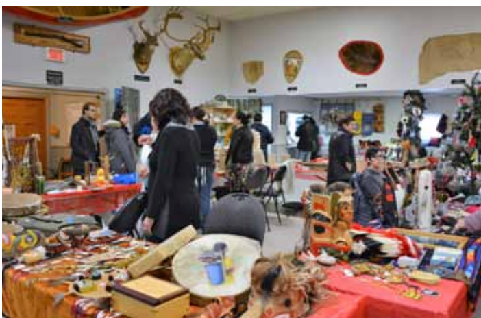
La 3 e édition du marché de Noël de Wendake à la salle Kondiaronk

Le marché de Noël de Wendake a encore connu un franc succès. Tenue à la salle Kondiaronk, cette 3 e édition a accueilli une trentaine d'artisans qui ont pu vendre leurs produits aux visiteurs. Parmi les nouveautés cette année, une carriole de 20 places qui faisait la navette entre le marché de Noël et le Salon du livre des Premières Nations, tenu simultanément à l'Hôtel-Musée Premières Nations.