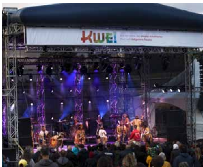
Le volet « spectacles » de l'événement a grandement contribué à faire connaître la culture autochtone et le talent des artistes de plusieurs communautés au public. Un spectacle de la troupe Sandokwa a été offert.