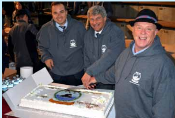
Gâteau de la Fête du Traité Huron-Britannique du 5 septembre 2017