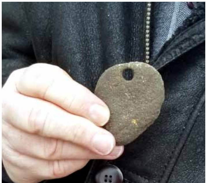
Ce même chantier à Barrie a permis de trouver un médaillon, un bijou pendentif en excellent état