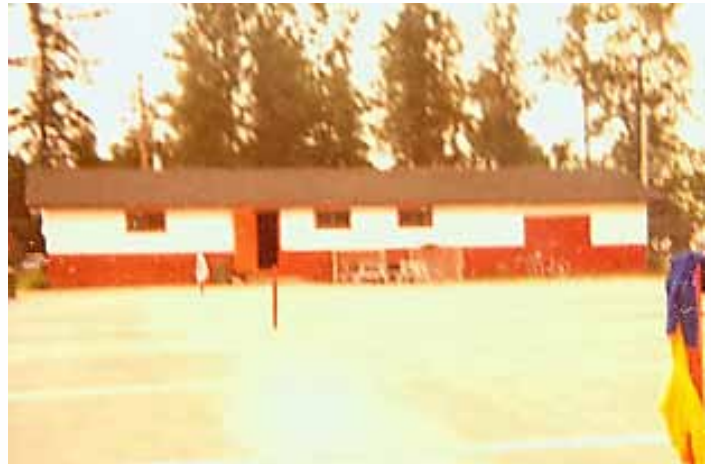
L'ancienne bâtisse de la patinoire sur la rue Max Gros-Louis, le terrain de jeu avait lieu à cet endroit l'été