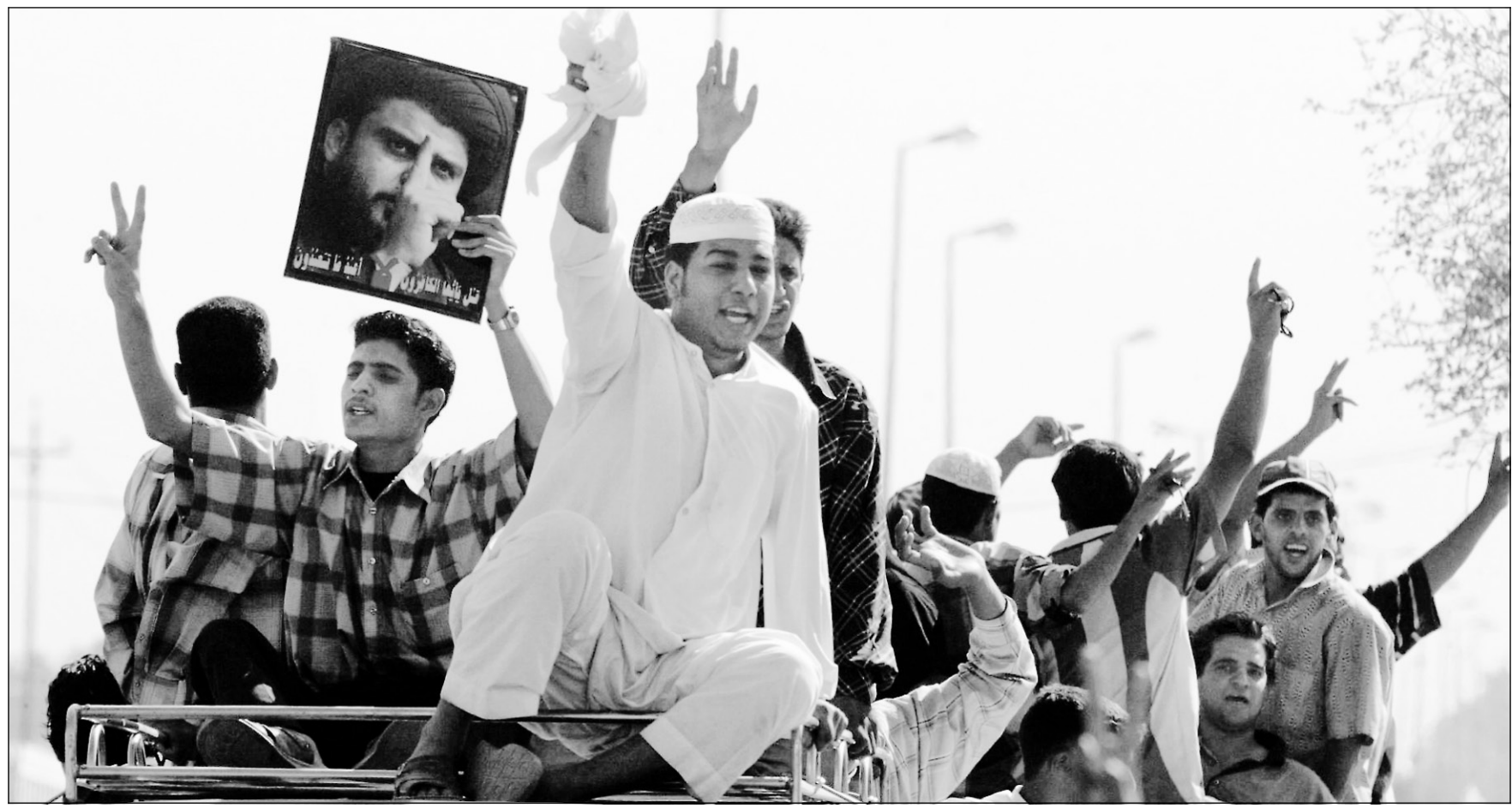
Des partisans chiites de Moqtada Sadr affluaient par milliers hier dans la ville sainte de Najaf, venant de Bagdad. Les pourparlers de vendredi devant conduire à un cessez-le-feu à Najaf ont échoué hier.

L'Armée du Mehdi a accusé le premier ministre Iyad Allawi d'être responsable de l'échec des négociations, tandis que Moqtada Sadr se déclarait prêt, selon un porte-parole, à accepter des Casques bleus de l'ONU en Irak à la place de la Force