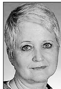
L'auteure est professeure à la retraite de l'École polytechnique.

Le nuage toxique qui a touché Montréal lundi soir dernier soulève des questions relatives à la sécurité civile en général, et en particulier au rôle des entreprises génératrices de risques dans celle-ci. À titre de spécialiste de la gestion des risques technologiques majeurs et des catastrophes, ainsi que d'ex-commissaire à la commission Nicolet sur le verglas et de responsable du retour d'expérience gouvernemental de l'incendie de BPC de Saint-Basile-le-Grand, je voudrais souligner quelques réflexions suscitées par cette alerte, que je crois