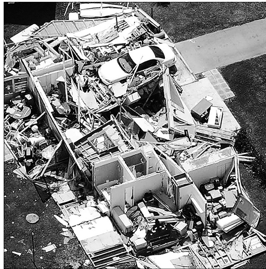
Une voiture s'est retrouvée dans les débris d'une maison, à Port Charlotte.

Son frère, le gouverneur de la Floride, Jeb Bush, a survolé la région en hélicoptère et évalué le coût des dégâts à plus de 15 milliards de dollars. Certains commentent déjà à évoquer l'ouragan Andrew, qui avait dévasté notamment le sud de la Floride en 1992, faisant 26 morts.