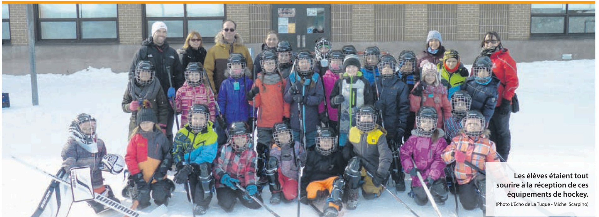
Les élèves étaient tout sourires à la réception de ces équipements de hockey.