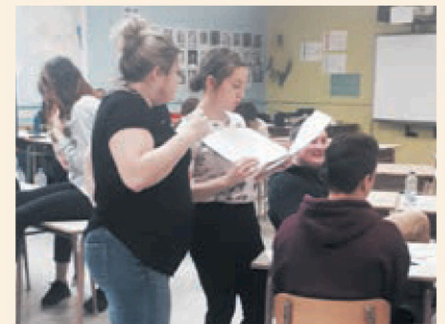
La Journée Carrière était présentée pour une 9 e année à l'école secondaire Champagnat.