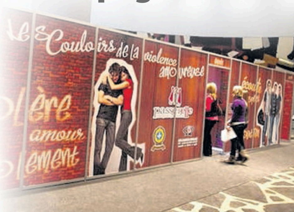
Le projet « Les couloirs de la violence amoureuse » est présenté jusqu'à vendredi à l'école secondaire Champagnat.

Il sera possible pour la population de visiter gratuitement « Les Couloirs de la violence amoureuse » à l'école secondaire Champagnat (entrée par le stationnement de l'École Forestière) ce vendredi 23 février de 13 h 15 à 16 h.