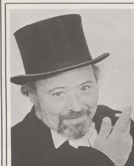
• EPISODE SURPRENANT •