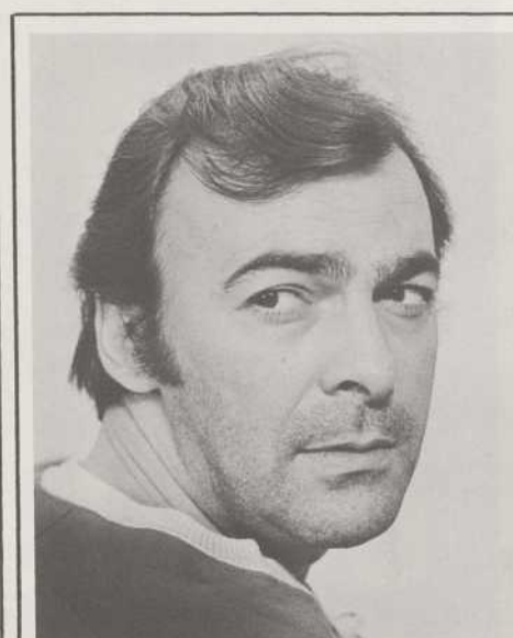
• BERTHELOT PETITBOIRE •