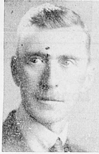
Au Congrès du 10e anniversaire de la Fédération Provinciale des Chambres de Jeunes du Québec

L'idée de la formation de chambres de commerce chez les jeunes a démontré sa valeur immédiatement par la faveur qu'elle a rencontrée non seulement chez ceux auxquels elle faisait directement appel, mais dans le monde des affaires généralement. L'expansion remarquable et rapide qu'a pris le mouvement, est une autre preuve de son opportunité.