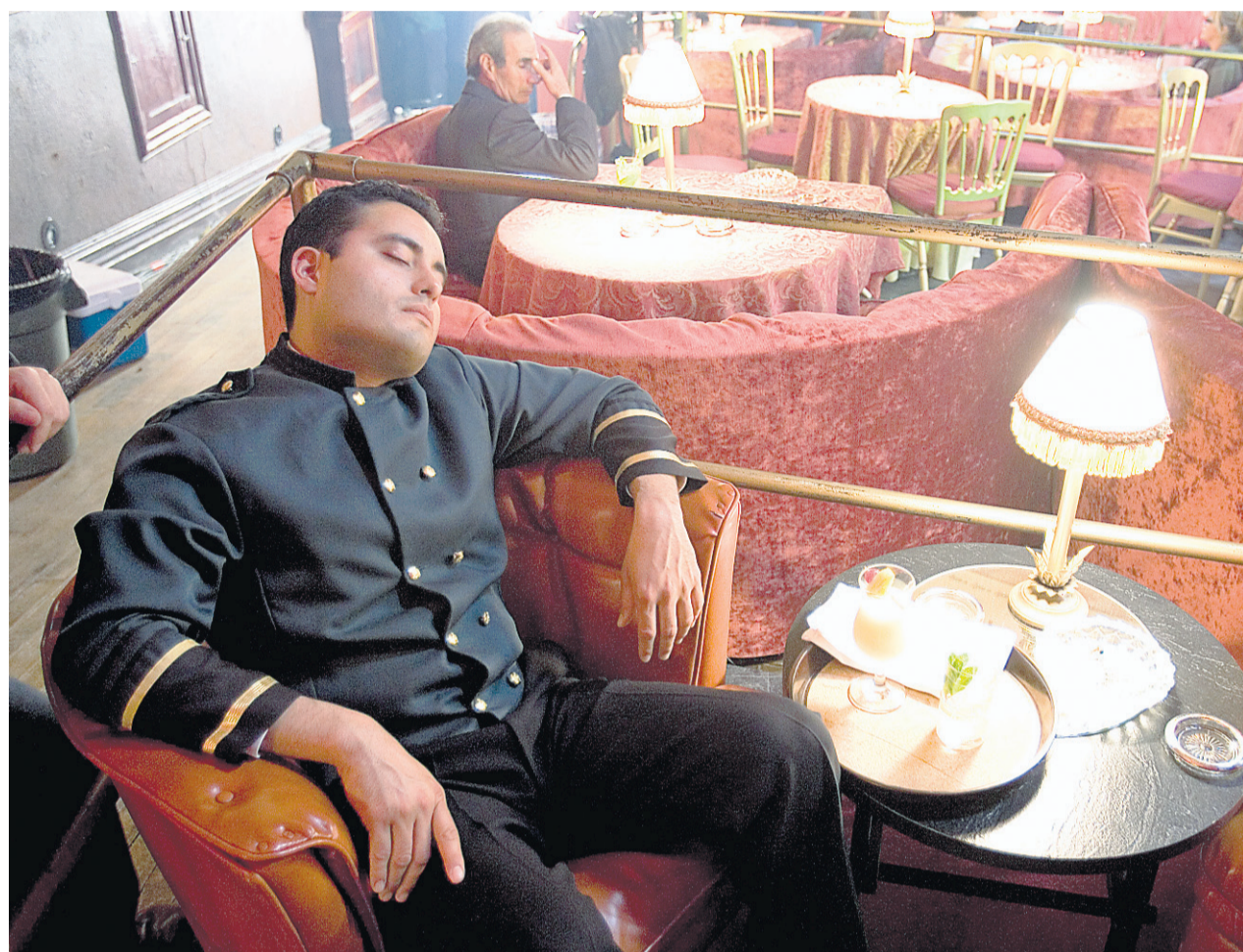
La sieste n'est pas synonyme de farniente, contrairement à la croyance populaire. Au contraire, elle permet de terminer en force sa journée de travail ou toute autre activité qui commande efforts physiques et concentration.

DORMIR L'APRÈS-MIDI N'EST PAS SYNONYME DE PARESSE. UN PETIT ROUPILLON PERMETTRAIT PLUTÔT D'AMÉLIORER SA PRODUCTIVITÉ AU TRAVAIL. VOYEZ CE QU'EN PENSENT LES SPÉCIALISTES. À LIRE EN PAGES 2 ET 4