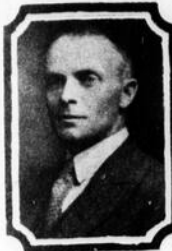
Hon. J. Adélard Godbout ministre.